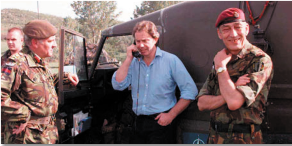
Tony Blair bisedim me telefon me trupat ushtarake Britanike HQ në kufirin e Kosovës afër Shkupit 3 Maj, 1999

sözün kime ait olduğu belliydi. Kendisi, onun bu kadar inatçı olduğunu hiçbir zaman duymamıştı ve T.B buna biraz şaşırılmıştı. Ancak, B.C-nin özde hareket ettiği gözüküyordu. O, T.B- nin görüşüyle oydandı, çünkü d' Alema-nın seçeneği, kara kuvvetlerinin çekilmesinin bir şekli olabilirdi. T. B açıkça şunları dedi: "48 saatlik bir molamız vardı, oysa yeni bir UNSCR için hemfikiriz , eğer Miloşeviç buna uymaz ise, NATO-nun 5 istemine dayanarak tekrar bombardıman edeceğiz ve kara kuvvetlerini kullanmayı öngörmekteyiz.". Bill, bunu fikir olarak uygun gördü.