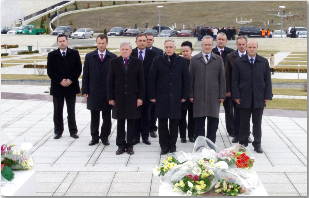
17.02.2013 tarihinde “Adem Jashari” anıtkabirinde saygı duruşu

Kosova Meclis Başkanı Sn. Jakup Krasniqi “Adem Jashari” Anıtında saygı duruşunda bulundu ve düzenlenen faaliyetler yanı sıra geleneksel olarak Jashari ailesini ziyaret etti. Bu arada Meclisin bir heyeti Sn. Xhavit Haliti'nin yönetiminde Kosova şehitlerinin gömütlerinde ve anıtlarında saygı duruşunda bulundu.