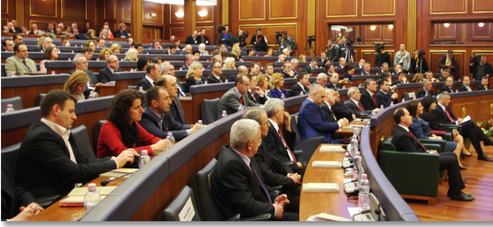
17 Şubat 2013 tarihinde salondan bir görüntü

Bugün kendi kanlarıyla bizi bu güne getiren şehitler ve özgürlük sevenlerin günüdür, efsanevi kahraman komutan Adem Jashari başta olmak üzere Kosova devletinin kurucuları ve babaların günüdür. Onların zaferi özgürlük kolyesi olarak sonuna kadar Kosova'yı süsleyecektir.