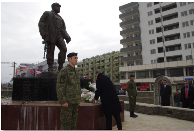
Klina'daki Mujë Krasniqi'nin Heykeli