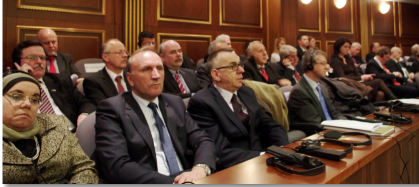
Diplomatik temsilcileri ve davet edilen dięer dostlar

Krasniqi ve konuřmasının devamında Kosova Cumhuriyeti'nin, lkemizin toprak btnlęine, egemenlięine ve anayasal dzenine zarar vermeden tm komřu lkelerle olduęu gibi Sırbistan ile de iliřkileri normal hale getirmek iin hazır olduęunu syledi. Sırbistan ile diyaloga deęinirken Krasniqi, bu mzakerelerde Avrupa Birlięinin arabulucu olduęu srece Kosova kuzeyinde bulunan kriminal strktrlerden vaz geerek, bu arada halk arasından temsilcilerin seilmesini olanaklı kılmak iin kurumlarımızın ve EULEX'in etili faaliyetine yol ahmak adına Sırp otoriteleri zerine olumlu etki edileceęine umut ediyoruz.