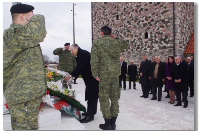
Glocan Şehitler Gömütlüğü