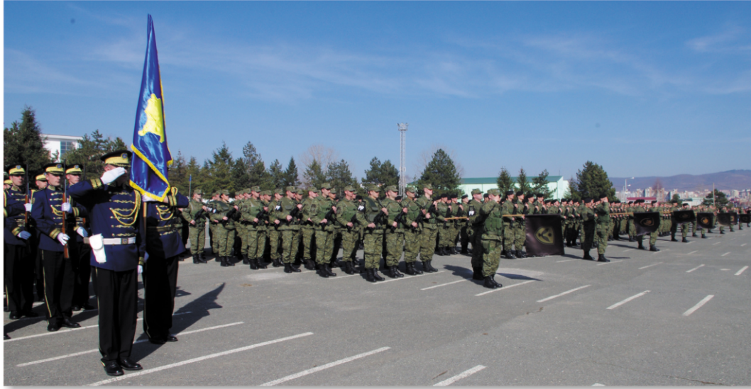
“Adem Jashari” Kışlasında törenli kutlama