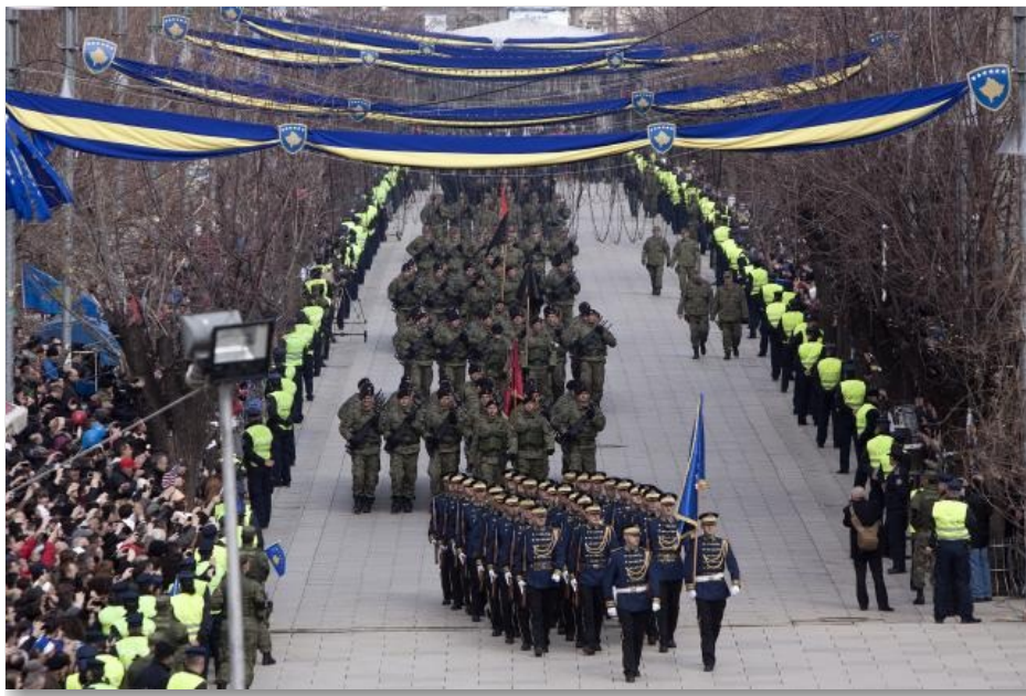
KGK birliklerinin 17 Şubat 2013 tarihli geçiti