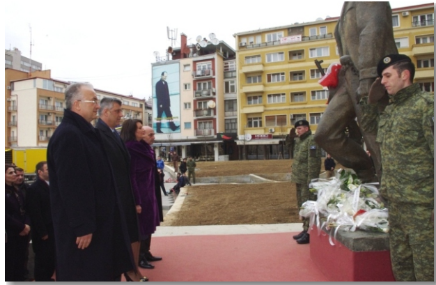
Zahir Pajaziti Anıtı