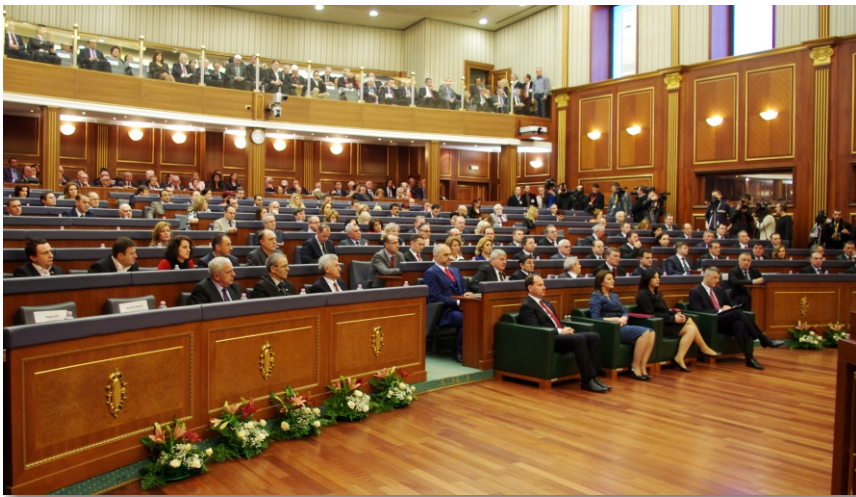
7 Şubat 2013 tarihli tören toplantısından görüntü

Kosova ekonomik kalkınma ve altyapının ilerletilmesinde başarı kaydetmiş ve dolayısıyla tüm toplumsal kategoriler için yaşam standartları iyileştirmiştir. Kosova yakın olarak 100 devlet tarafından tanınmıştır" diye vurguladı Başbakan Thaçi. Konuşmasının devamında en kısa zamanda yeni tanımların gelmesinin beklendiğini ileri sürdü. Devamında o Kosova'nın AB ve NATO gibi Euro Atlantik kurumlara üye olmak ve Birleşmiş Milletler Örgütüne üye olma yolunda bulunduğunu vurguladı. "Doğallığıyla tüm bu süreçte Kosova, sıkıntılarla karşı karşıya gelecektir, uluslararası dostlarımızla birlikte beraberce ve sıkı koordinasyonla bu hedeflerimizin gerçekleşmesini başaracağız" dedi Başbakan Hasim Thaçi.