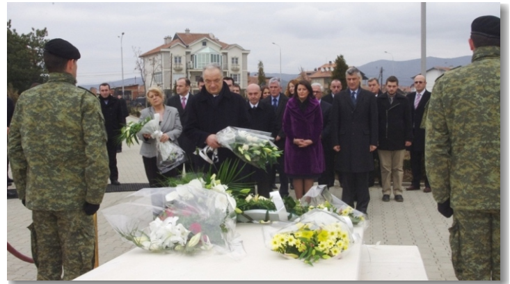
Eski Cumhurbaşkanı İbrahim Rugova'nın gömütlüğü

Bağımsızlığın 5. yıldönümü dolayısıyla Kosova'da düzenlenen sayısız faaliyetler arasında Priştine'nin "Nëna Terezë" kent merkezinde örgütlenen KGG (FSK) askeri birliklerinin geçit töreni ile sürdürülmektedir. Bu tören Kosova'nın binlerce vatandaş ve Kosova devletinin en üst düzey yetkilileri, Arnavutluk Cumhurbaşkanı Snc Bujar Nishani ve bu münasebetle davet edilen Mısır Arap Cumhurbaşkanı Sn. Pakinam Hassan Khalil El Sharkawy ve Kosova'da akredite olmuş diplomatik koru gibi çok sayıda dostumuz tarafından takip edildi.