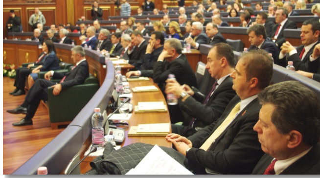
17 Şubat 2013 tarihli tören toplantısından görüntü

Tevazu ve minnetle bugün Kosova'nın ilk Cumhurbaşkanı ve Bağımsız Kosova'nın Mimarı olan İbrahim Rugova'yı hatırlıyor ve onurlandırıyoruz. Onun barış için tereddütsüz inancı, bağlılığını, çalışmaları, özgürlük ve Kosova adına olgunluğu ve kararlılığını onurlandırmaktayız. Bugün onun eserini onurlandırmaktayız.