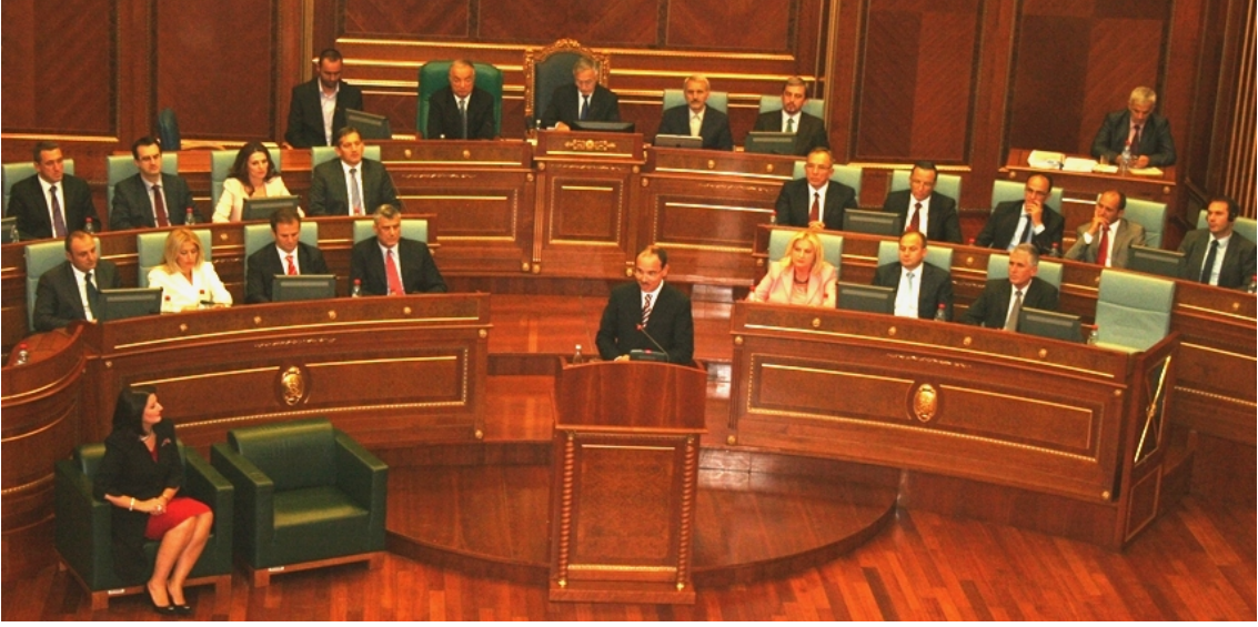
Cumhurbaşkanı Nishani'nin konuşması

onurlandırma ve büyük saygıyla anmaktayız.