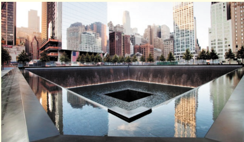
Kosova Meclisi heyeti, "İkiz Kulelerde" Anıtı'na çelenk taktı