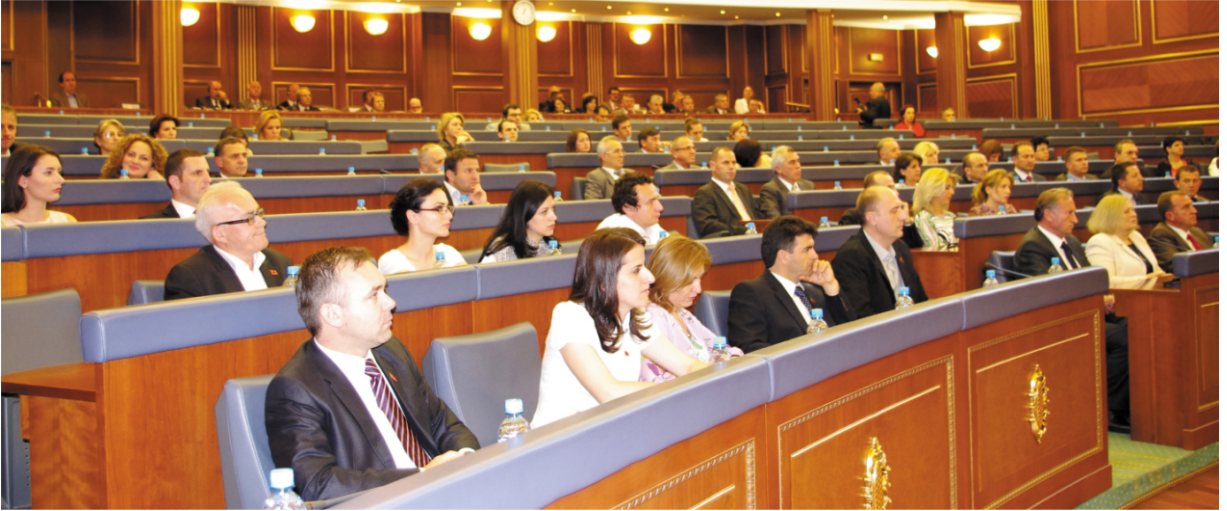
Salondan bir görüntü

Arnavutluğun sarsılmaz tutumunu bir daha tekrarlama izin veriniz, buyusa Kosova statüsünün ve