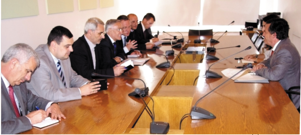
Portekizli üyeleri ile toplantı