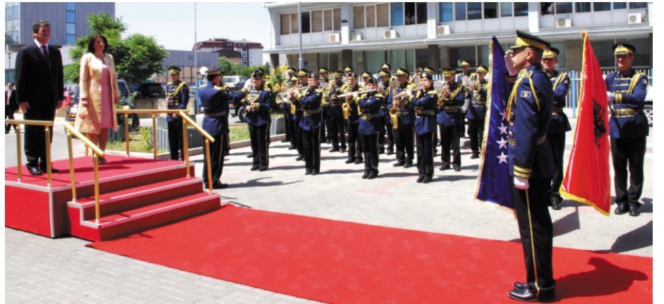
Başkan Bamir Topi