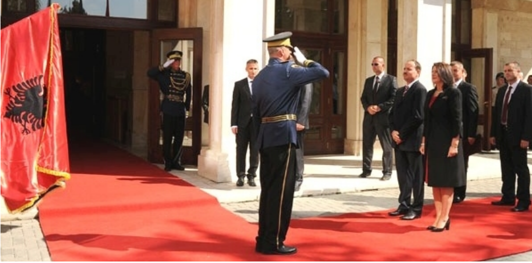
Başkan Bujar Nishani