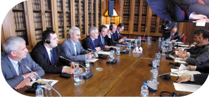
Parlamento ile Toplantı dışışleri

Parlamento Başkanı Krasniqi, Dışışleri Bakanlığı'nda Devlet Sekreterine ve Dışışleri Komisyon üyelerine, şimdiye kadar sundukları katkılar ve Portekiz kurumlarının, bu desteği ileride de sunmaya hazır olduklarından dolayı teşekkürlerini belirtti.