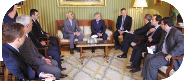
Bakanı ile Toplantı Portekiz'in Dışışleri

Portekiz'in üst düzey yetkilileri, Kosova parlamento heyetinin Portekiz ziyaretinin özel önem taşıdığını ileri sürerek, ülkelerinin Kosova'daki gelişmeleri dikkatle takip ettiğini ve Kosova'nın devlet inşaatı doğrultusunda izlemekte olduğu yol ve uluslararası alanda karşılaşmakta olduğu sorunlar hakkında bilgi sahibi olduklarını ileri sürdüler. Onlar Kosova'daki güncel durum hakkında bilgi isteyerek, Portekiz'in demokrasinin inşaatı, yasaların incelenmesi, onun uluslararası çapta tanınması gibi hedeflerine ulaşması konusunda Kosova'yı destekleyeceklerine dair söz verdiler.