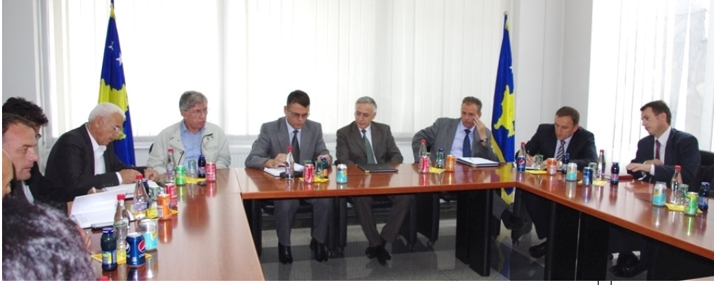
Maden ve Minerallere ait Bağımsız Komisyonla toplantı (MMBK)

Hedeflerin yerine getirilmesi doğrultusunda Komisyonun karşılıksız desteği olacaktır