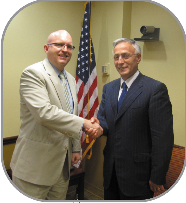
Reeker - Krasniqi

Parlamento Başkanı Krasniqi, Avrupa ile Euro-Asya Konuları Genel Sekreter yardımcısı Sn. Reeker'i, denetimli bağımsızlığın sona erdirilmesi ile ilgili süreç, kuzeydeki gelişmeler, Belgrad ile dialog ve sözleşmelerin Sırbistan tarafından uygulanmaması, vize kolaylıkları ile ilgili süreç ve fizibilite çalışmaları ile ilgili belgeyi almakla ilgili konularda Meclis ve Hükümet'in çalışmalarından başlayarak Kosova'daki son gelişmeler hakkında bilgi verdi. Kosova Meclis başkanı, aynı zamanda, devletler tarafından tanınmalar ve Kosova'nın uluslararası örgütlere üyeliği ile ilgili süreçlere desteğin sunulmasını da talep etti.