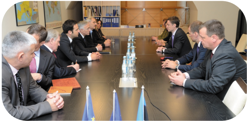
Dışişleri Komisyonuyla toplantıdan görüntü

Dışişleri Bakanı Urmas Paet, Estonya'nın, Kosova'yı Avrupa entegrasyonu ve vize kolaylıkları sürecinde destekleme konusundaki tutumunu bir daha belirtti. “Batı Balkan Yöresinde Kosova, devijimin sınırlı olduğu tek ülke olarak kaldı. Avrupa Birliği, Kosova için vize kolaylıkları ile ilgili konuyu aciden ele alması gerekir. Estonya, Kosova ile Sırbistan arasında dialogu selamladı” diye vurguladı Sn. Paet.