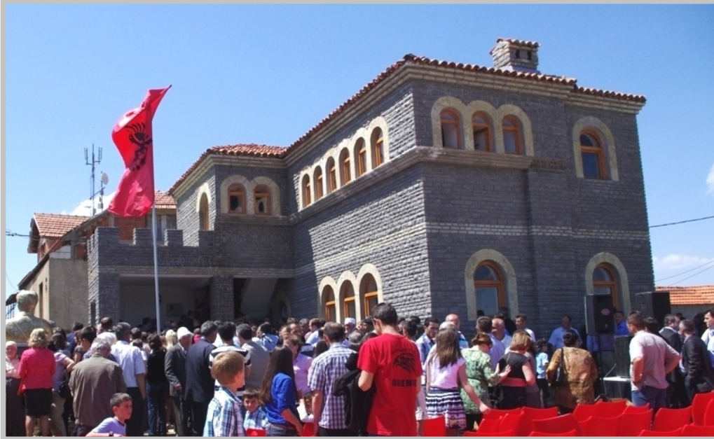
Iljaz Kodra kulesi, Prekaz, Skenderaj

Yayımlayan: Medya ve Kamuyla İlişkiler Dairesi Editör: Petrit Subashi, Yayınlardan görevli memur Çeviri hizmetleri dairesi