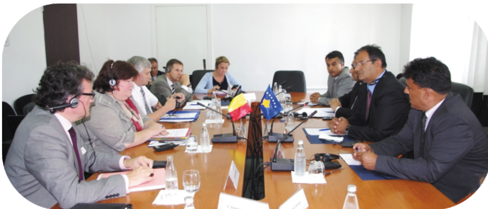
Pogled sa sastanka

država preduzela stroge mere u vezi sa dozvolom boravka doseljenika iz balkanskih zemalja i Indija u Belgiji, upravo zbog velikog broja azilanata (25 hiljada prošle godine), za razmatranje razloga za odobravanje ili uskraćivanje boravka (u roku od 15 dana), što podrazumeva dobrovoljno ili prinudno vraćanje u zemlji porekla. Gospođa de Blok je izrazila svoju zabrinutost da će dobijanjem putokaza za liberalizaciju viza za Kosovo, povećati broj Kosovara koji će ciljati da ostanu u Belgiji i drugim zemljama EU, te je zatražila preduzimanje svih kako se ne bi to zloupotrebilo.