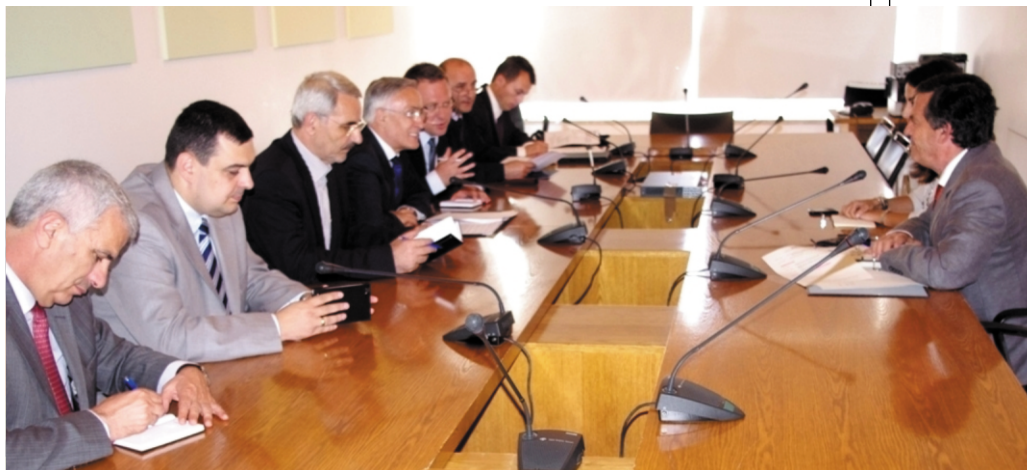
Sastanak sa članovima Portugalaca

Predsednik Skupštine Krasniqi izrazio je zahvalnost portugalijskim prijateljima o stavu Portugalije prema Kosovu, vojnu podršku i priznavanje nezavisnosti