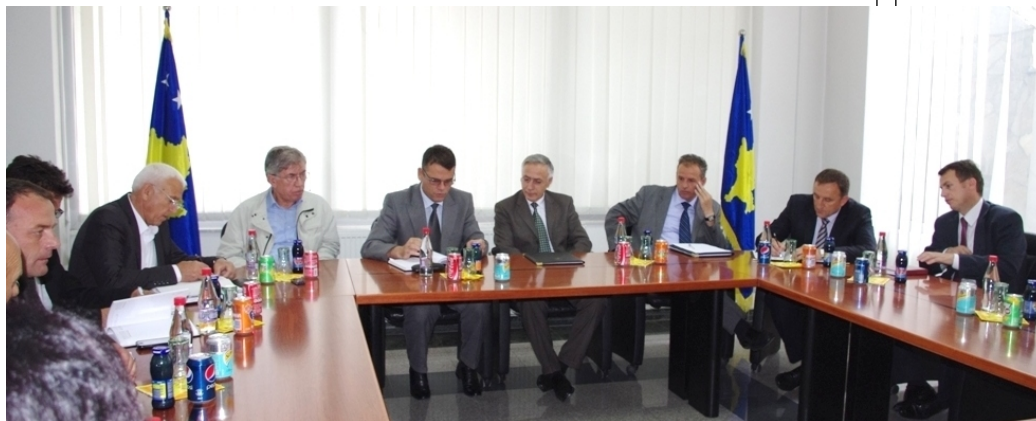
Sastanak sa Nezavisne komisije za rudnike i minerale (NKRM)

Komisija će, za realizaciju ciljeva, imati bespoštednu podršku