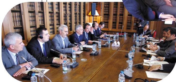
Sastanak sa parlamentarnim spoljni poslovi

Predsednik Krasniqi se zahvali državnim sekretaru u Ministarstvu spoljnih poslova, kao i članovima Komisije za spoljne poslove za dosadašnju podršku i za spremnost institucija Portugalije da nastave sa ovom podrškom i u buduće. I na ovim susretima Krasniqi je tražio da Portugalija proširi uticaj kod njenih prijateljskih država da priznaju nezavisnost Kosova.