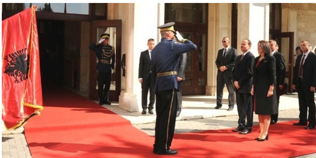
Presidnik Bujar Nishani

Čelnik albanske države posetio je Muzej Prizrenskog saveza i verske objekte na Kosovu, kao katoličku crkvu u Binću, manastir Dečana i džamiju Sinan paše. U prisustvu mnogih predstavnika akademskog sveta, kosovskog civilnog društva, intelektualaca, pedagoga i studenata g-din Nišani je održao govor na Univerzitetu AAB.