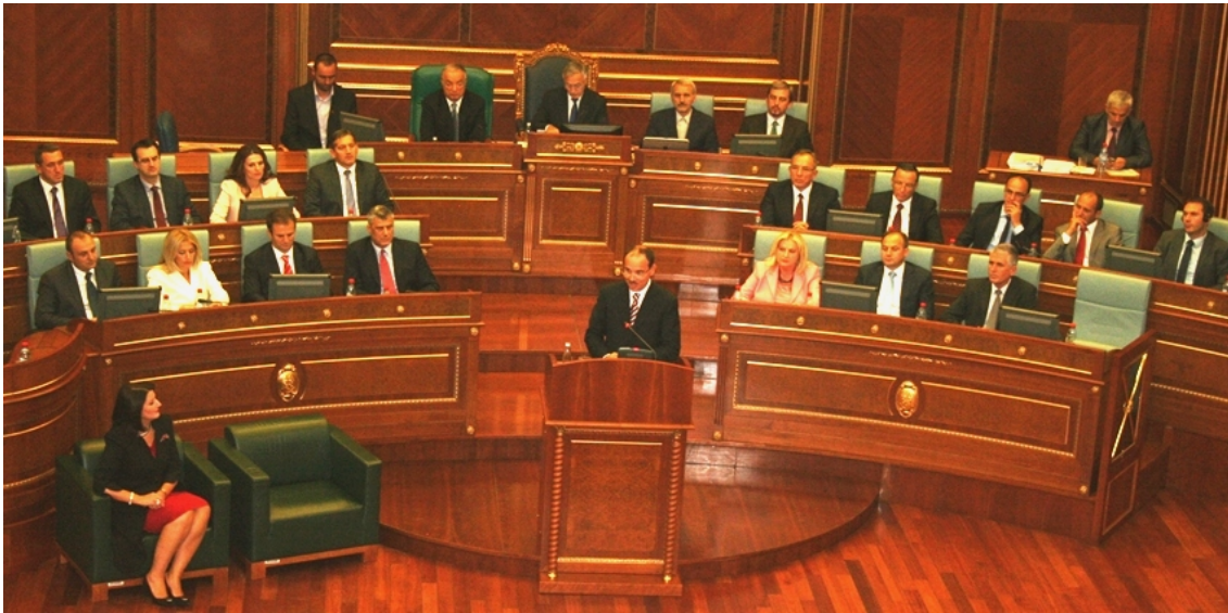
Govor predsednika Skupštine Nišani