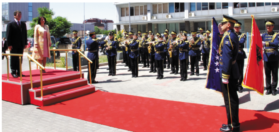
Presidnik Bamir Topi