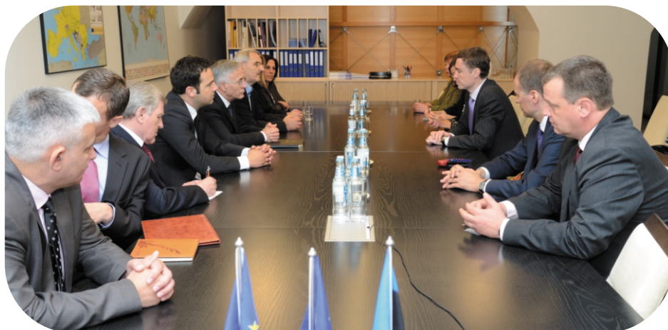
Spoljni odbor sastanak

Ministar spoljnih poslova Urmis Paet potvrdio je zvanični stav Estonije za pružanje podrške Kosovu u procesu evropske integracije i liberalizacije viza. "U regionu zapadnog Balkana, Kosovo je ostalo jedina zemlja sa ograničenim kretanjem. Neophodno je da Evropska unija hitno razmatra pitanje liberalizacije viza za Kosovo. Estonija je podržala dijalog između Kosova i Srbije", istakao je g-din Paet.