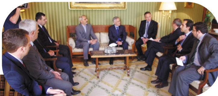
Sastanak sa ministrom portugalskih Strani

Visoki zvaničnici Portugalije su, okvalifikujući posetu parlamentarne delegacije Kosova u Portugaliji od posebnog značaja, naglasili da njihova zemlja pažljivo prati razvoje na Kosovu i dobro je informisana o putu izgradnje njegove državnosti, kao i o izazovima sa kojima se ono suočava na međunarodnoj ravni. Oni su izrazili njihovo interesovanje o aktuelnoj situaciji na Kosovu, a obavezivali su se da će Portugalija podržati Kosovo u ispunjavanju ciljeva, i to: izgradnja demokratije, vladavina prava, međunarodna priznavanja i dr.