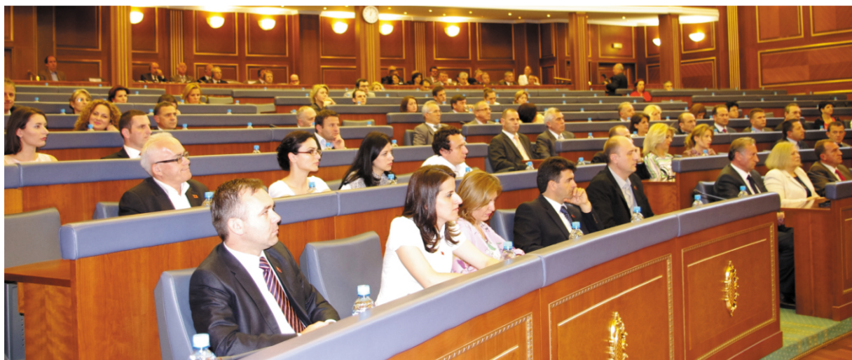
Pogled iz sale

Postignuti sporazumi moraju se jasno, bez ekvivoka, sprovoditi, što brže i uz međunarodnu garanciju, koji će