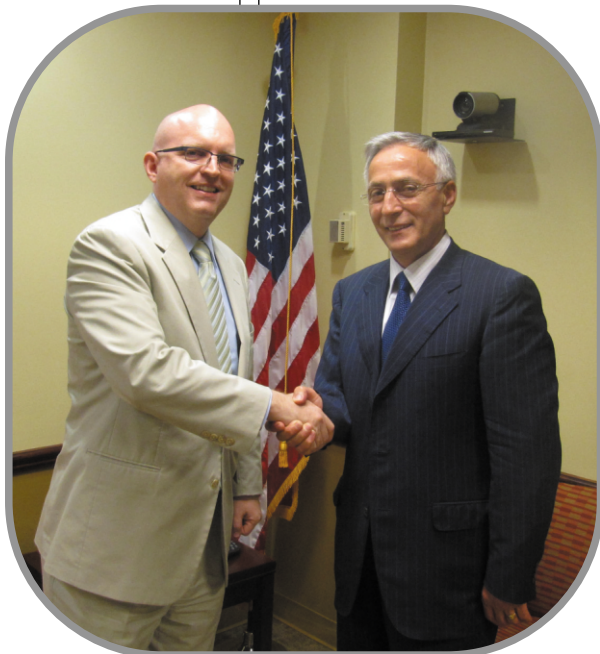
Reeker - Krasniqi

Delegacija Skupštine Kosova je imala jedan susret u Američkom Stejt Departmentu, sa zamenikom pomoćnika sekretara za evropska i evro-azijska pitanja, Philip Reeker, sa pomoćnicom ambasadora USAID-a, Peige Alexander, i održao je jedno predavanje u Centru za međunarodne strateške studije u Vašingtonu, na temu „Izgradnja državnosti Kosova“. Zamenik - pomoćnika sekretara za evropska i evro-azijska pitanja, Reeker, potvrđujući ponovo američku podršku za Kosovo, naglasio je da će se zajednički sa institucijama Kosova raditi na uspešnom zaokruživanju procesa međunarodnog nadgledanja nezavisnosti.