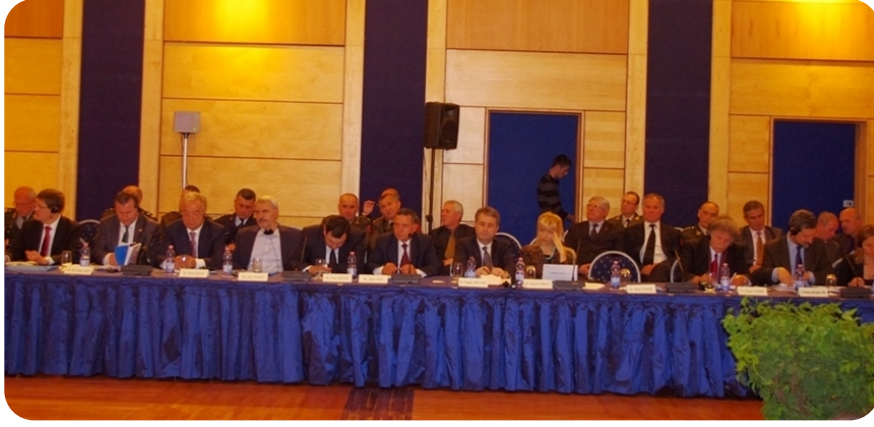
NATO Parlamenter Meclisi'nin Konferansı.