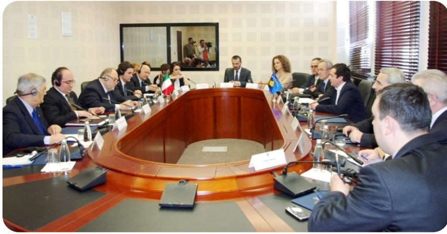
Dışışleri Komisyonun, AGİT'in İtalya Parlamento heyeti ile toplantısı

Kurti ve Dışışleri Komisyonu Roma resmi ziyaretine davet edildi