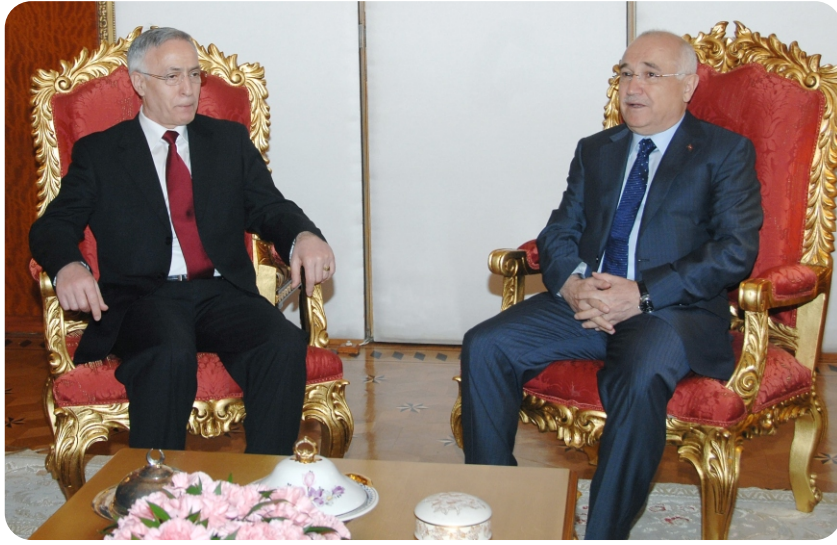
Krasniqi - Çiçek