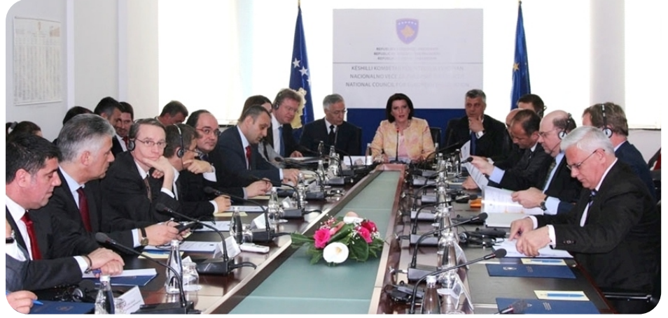
Avrupa Entegrasyonuna ait Ulusal Konsey

Kosova Cumhuriyeti Meclis Başkanı Dr. Jakup Krasniqi, Kosova Cumhurbaşkanı Atifete Jahjaga başkanlığı altında yönetilen Avrupa Entegrasyonuna ait Ulusal Konseyin açılış toplantısına katıldı. Bu münasebetle Meclis Başkanı Krasniqi toplantıda hazır bulunanlara şunları dedi:"