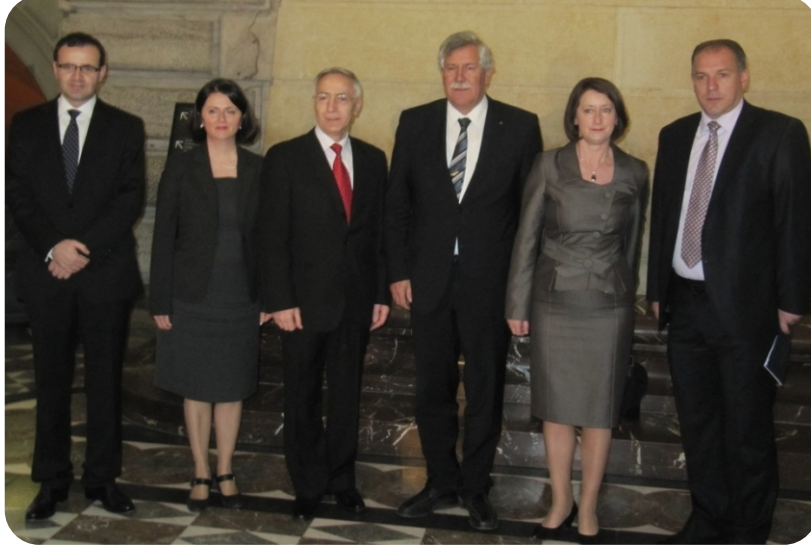
Kosova parlamento heyeti – İsviçre Ulusal Konsey Başkanı Walter

Başkan Krasniqi, ev sahibini Kosova'daki gelişmeler, demokratik kurumların oluşması ve onların hedefleri, uluslararası tanınmalar, Meclis çalışmaları ve daha bazı çalışmalar hakkında bilgi verdi. Parlamento başkanı, Kosova'nın geçmiş olduğu zor dönemlerinde Kosova'ya İsviçre'nin vermiş olduğu destekten dolayı İsviçreli dostlarına teşekkür etti. Dolayısıyla o Kosova ile İsviçre arasında varılan anlaşmalara değinerek iki ülke arasındaki ilişkilerin daha da ilerletilmesini istedi.