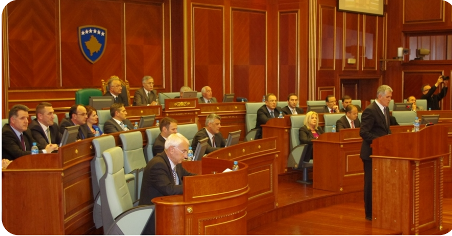
İçişleri Bakanı Rexhepi'nin konuşması

parlamento tartışmalarının da kuzeydeki durumun kontrol altına alınması ve orada yaşamakta olan etnik kökene bakılmaksızın vatandaşların hayatlarının güvence altına alınmasına etki edeceğine inandığını söyledi.