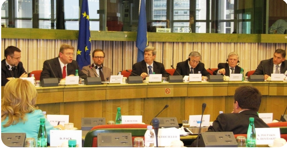
Avrupa Parlamentosundaki çalışmalardan bir görüntü

Avrupa Parlamentosu (AP) ve Kosova Meclisi arasında iki günlük ortak toplantıların çalışmaları, Arnavutluk, Bosna Hersek, Sırbistan, Karadağ ve Kosova ile ilişkilere ait AP Heyet başkanı Sn. Eduart Kukan tarafından yönetildi. Bu iki gün süresinde Kosova'nın Avrupa entegrasyonuna doğru ilerlemesi, hukuk üstünlüğü ve rüşvet ve örgütlü suçlara karşı savaşım, vize kolaylıkları, enerji ve çevre korunması, ekonomik kalkınma ve Belgrat ile Priştine arasındaki müzakerelerle ilgili konular tartışıldı. Toplantının sonunda katılımcılar, ortak bir nihai bildirge metnin yayınlanmasını kararlaştırdılar.