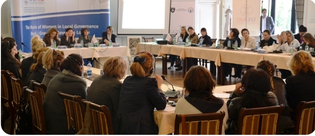
Konferans toplantısından bir görüntü

Cinsiyet kotasının uygulanması aracılığıyla kurumların ilk görev sürelerinden itibaren kadınların daha fazla toplumsal süreçlere dahil olmaları için şartlar yaratılmıştır