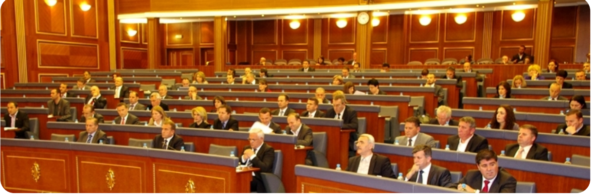
Olağanüstü meclis toplantısı süresinde salondan bir görüntü

Meclis toplantısında konuşan tüm parlamento gruplarının çok sayıda milletvekili, ülke kuzeyinde güvenliğin ağır durumda olduğu düşüncesinde oydaştı ancak onlar, bu duruma sebep olanlar ve nedenler konusunda tutumlarında farklıydı.