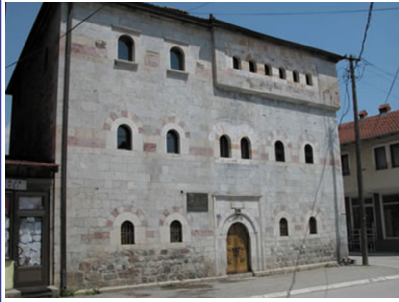
Geleneskel kule, İpek