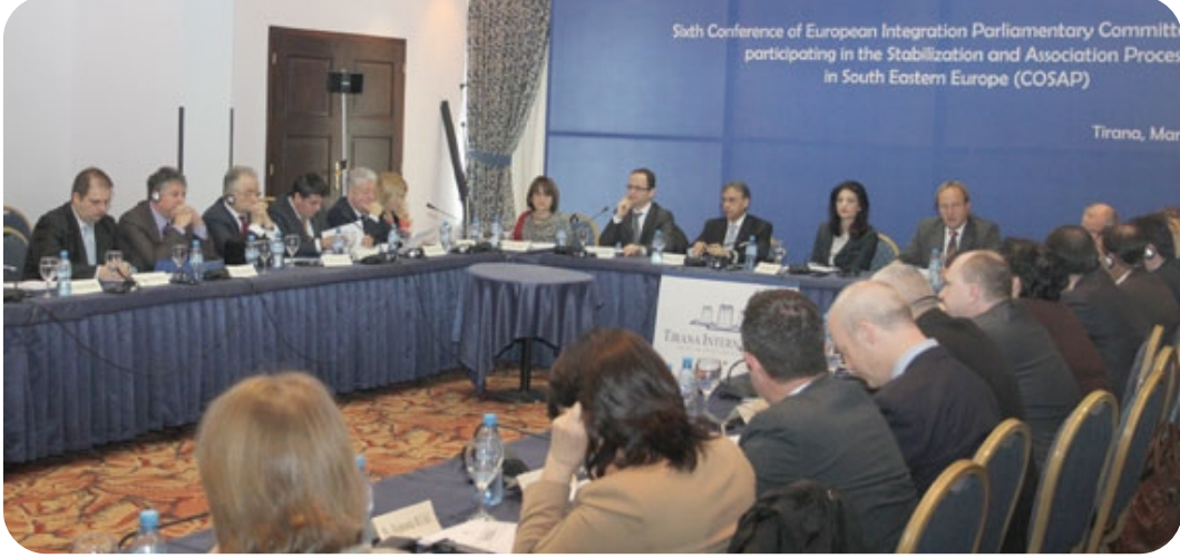
Konferans toplantısından bir görüntü (COSAP)

09.03. 2012 tarihinde Tiran'da İstikrar ve Ortaklık Sürecine (COSAP) Katılımcı Devletlerin Entegrasyon Parlamento Komisyonları'nın Altıncı Konferansı'nın çalışmaları yapıldı. Konferans çalışmalarını Arnavutluk Cumhuriyeti meclis Başkanı Sn. Jozefina Topalli açtı. Bu konferansta Kosova Cumhuriyeti Meclisi Avrupa Entegrasyon Komisyonu Başkanı Sn. Lutfi Haziri, Kosova Meclisi Asbaşkanı ve Avrupa Entegrasyon Komisyonu Asbaşkanı olan Sn. Xhavit Haliti tarafından temsil edilmektedir.