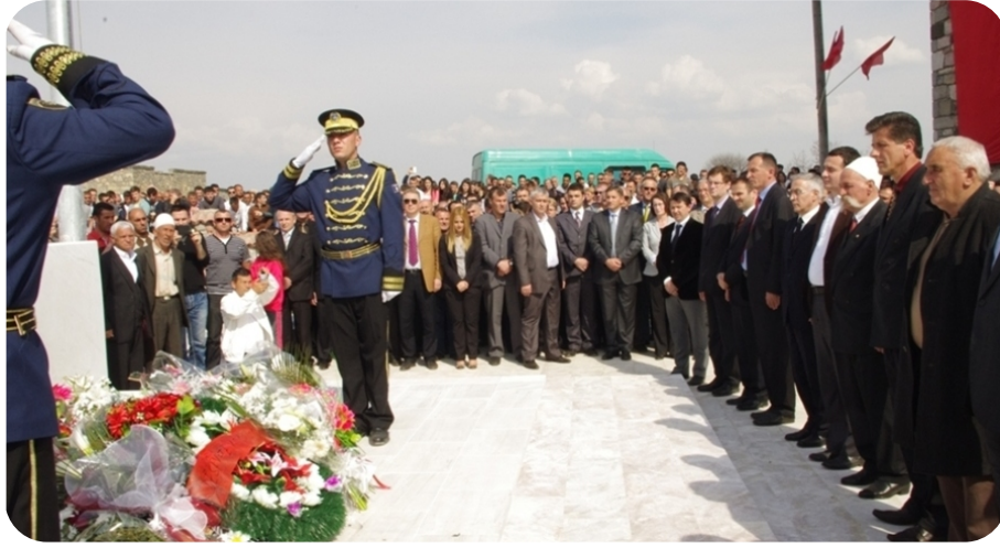
Glocan'daki şehitlere saygı duruşu

Ölüm ya da kalım mücadelesinde ve onun cesur komutanları sadece bir defa değil, her zaman için bugün yaşamış olduğumuz özgürlük ile Bağımsızlığın elmazını teşkil etmektedir. Bizler hepimiz özgürlük savaşımızın gözyaşı temizliğine inandığımız gibi, uluslararası adalete de inanmaktayız, böylece komutan Ramush Haradinaj ile savaş arkadaşının bir an önce suçsuz ilan edilmelerini ve Kosova ile kendi ailelerine dönmelerini sabırsızlıkla beklemekteyiz.