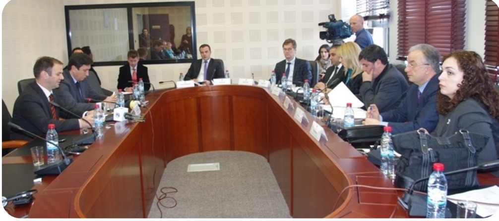
Adalet Bakanı Kuçi – Avrupa Entegrasyonu Komisyonu

Avrupa Entegrasyonu Komisyonu, elde edilen ilerlemeyle ilgili bakanlıkların etkin bir şekilde gözetlenmesini başlattı. Sözkonusu Komisyon, elde edilen ilerlemenin değerlendirmesini Avrupa günemine göre yapacaktır. Avrupa Entegrasyonu Komisyonunun başkanının belirttiğine göre bu, Kosova Meclisi tarafından bu yıl için ilk raporun hazırlanmasına bağlıdır.