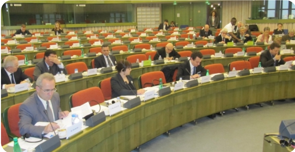
Avrupa Parlamentosundaki çalışmalardan bir görüntü

Avrupa Parlamentosu (AP) ve Kosova Meclisi arasında iki günlük ortak toplantıların çalışmaları, Arnavutluk, Bosna Hersek, Sırbistan, Karadağ ve Kosova ile ilişkilere ait AP Heyet başkanı Sn. Eduart Kukan tarafından yönetildi. Bu iki gün süresinde Kosova'nın Avrupa entegrasyonuna doğru ilerlemesi, hukuk üstünlüğü ve rüşvet ve örgütlü suçlara karşı savaşım, vize kolaylıkları, enerji ve çevre korunması, ekonomik kalkınma ve Belgrat ile Priştine arasındaki müzakerelerle ilgili konular tartışıldı. Toplantının sonunda katılımcılar, ortak bir nihai bildirge metnin yayınlanmasını kararlaştırdılar.