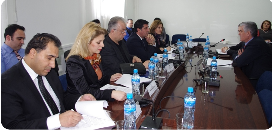
İçişleri Bakanı Sayın Bajram Rexhepi – Avrupa Entegrasyonu Komisyonu

Komisyon Başkanı Lutfi Haziri tarafından yönetilen Avrupa Entegrasyonu Komisyonu toplantısında, İçişleri Bakanı Bajram Rexhepi rapor sundu.