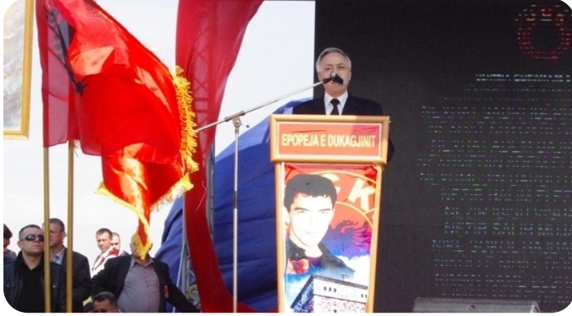
“Dukacin'de UÇK Destanı” Gösterisinde Meclis Başkanının konuşması

Dün savaşta olduğu gibi, bugün barışta da ülkemiz için büyük görevler ortak güçlerle daha iyi yerine getirilir, çünkü vatan için ideal tektir