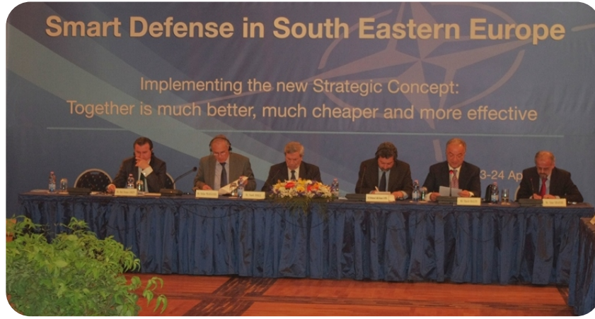
NATO Parlamenter Meclisi'nin Konferansı.

Tiran, 23 Nisan 2012. Arnavutluk Meclisi'nin himayesi altında, NATO Parlamenter Meclisi ile işbirliğinde Tiran'da “Akıllı savunma – Güney Doğu Avrupa ülkeleri arasında işbirliği ve koordinasyon ve savunum mal mühimmatların dağıtılması” başlığı altında üç günlük konferans çalışmalarına başladı.