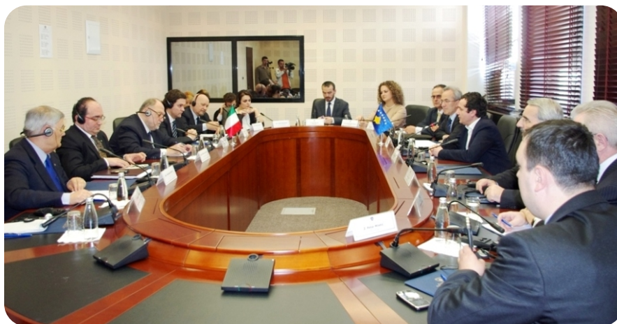
Sastanak Komisije za spoljne poslove sa delegacijom italijanskih parlamentaraca OEBS-a

Kurti i Komisija za spoljne poslove pozvani su u službenu posetu Rimu