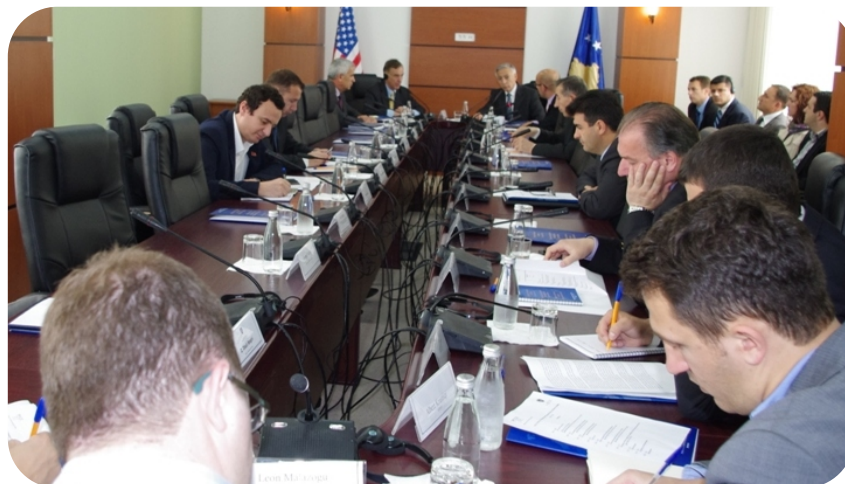
Pogled sa susreta

Ovo je jedna posebna mogućnost za parlamentarne demokratije da se legislativnoj grani pruža jedna prava snaga", rekao je Dean.