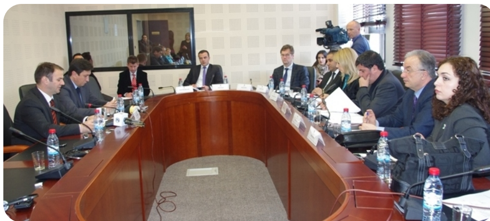
Ministar pravde Kuçi – Komisija za evropske integracije

Avrupa Entegrasyonu Komisyonu, elde edilen ilerlemeyle ilgili bakanlıkların etkin bir şekilde gözetlenmesini başlattı. Sözkonusu Komisyon, elde edilen ilerlemenin değerlendirmesini Avrupa günemine göre yapacaktır. Avrupa Entegrasyonu Komisyonu Başkanının belirttiğine göre bu, Kosova Meclisi tarafından bu yıl için ilk raporun hazırlanmasına bağlıdır.