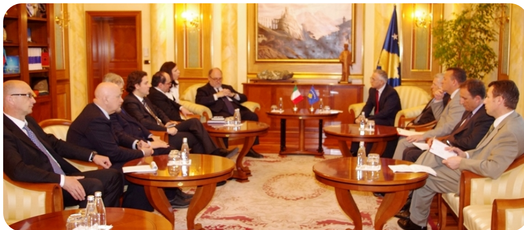
Kranići – Delegacija italijanskih parlamentaraca Generalne skupštine OEBS-a

Razmatraju se modaliteti da Kosovo postane deo Generalne skupštine OEBS-a Kosovo stalno čini kompromise, dok Srbija nije pokazala spremnost za implementaciju postignutih sporazuma