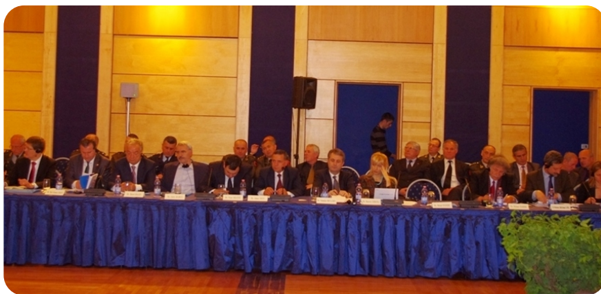
Konferencija Parlamentarne Asambleje NATO-a.

U tom okviru, ova konferencija ima za cilj da se nosi sa limitiranim izvorima preko prikupljanja i raspodele aseta odbrane, specijalizacije, saradnje, i koordinacije na regionalnom nivou.