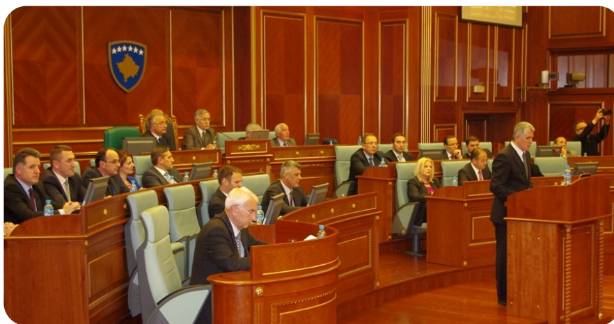
Govor ministra unutrašnjih poslova, Rexhepi

činom prema porodici Selver Haradinaj. On je izrazio ubeđenje da će i ova parlamentarna rasprava uticati na stanje na severu postavljajući pod kontrolom i da se obezbeđuje život građana, bez etničkih razlika, koji tamo žive.