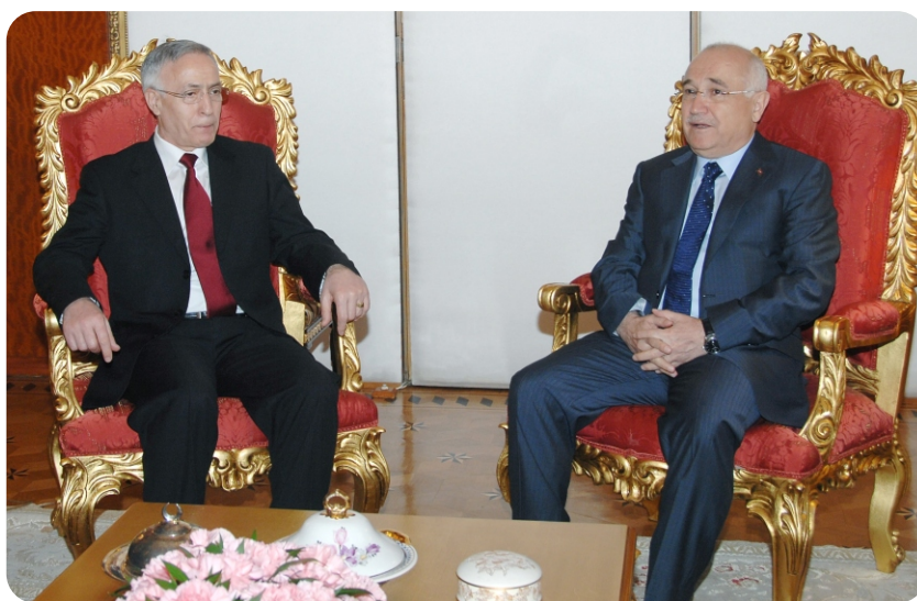
Krasniqi - Çiçek