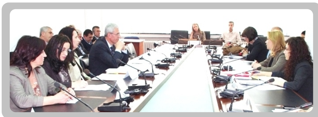
Javna rasprava Komisije za ljudska prava, ravnopravnost polova...

Narodni advokat, Ismail Kurteshi, na početku je informisao prisutne o izazovima koji ga prate ovu instituciju. Intervencija Vlade u budžetskoj nezavisnosti ove institucije, ne isplaćivanje plata zamenicima Narodnog advokata i nedostatak tehničkih prostorija, predstavljaju najveći izazov u primenjivanju ovog zakona, naveo je Kurteshi. On je zatim govorio i o pojedinim članovima zakona koji neposredno utiču na neefikasan rad Narodnog advokata, kao i zvaničnicima institucije Narodnog advokata. Tim povodom on je napomenuo zakonsku odredbu koja ne uređuje na potreban način imunitet Narodnog advokata. Pozivajući se na dostignućima institucije kojoj on rukovodi, Kurteshi je napomenuo činjenicu da oni imaju dobru