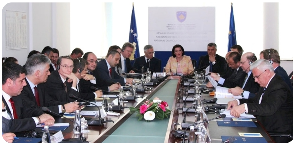
Nacionalni savet za evropske integracije

Predsednik Skupštine Republike Kosova, dr. Jakup Krasniqi, učestvovao je u susretu inauguracije Nacionalnog saveta za evropske integracije, pod predsedavanjem predsednice Republike Kosova, Atifete Jahjaga. Tom povodom predsednik Skupštine se prisutnima obratio ovim rečima: