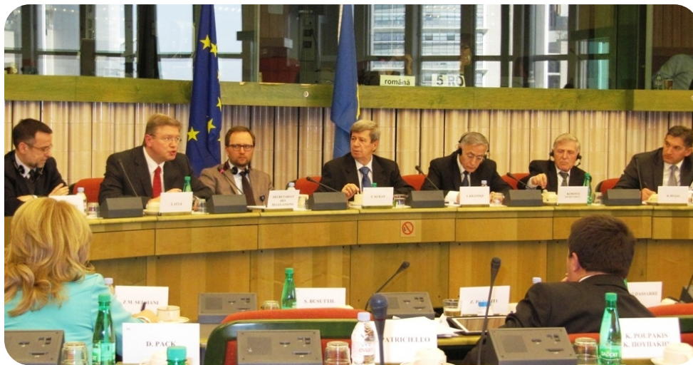
Pogled na tok rada u Evropskom parlamentu

EP i Parlamentarna delegacija Skupštine Kosova doneli su zajedničku deklaraciju u kojoj su uključene diskusije tokom sastanka