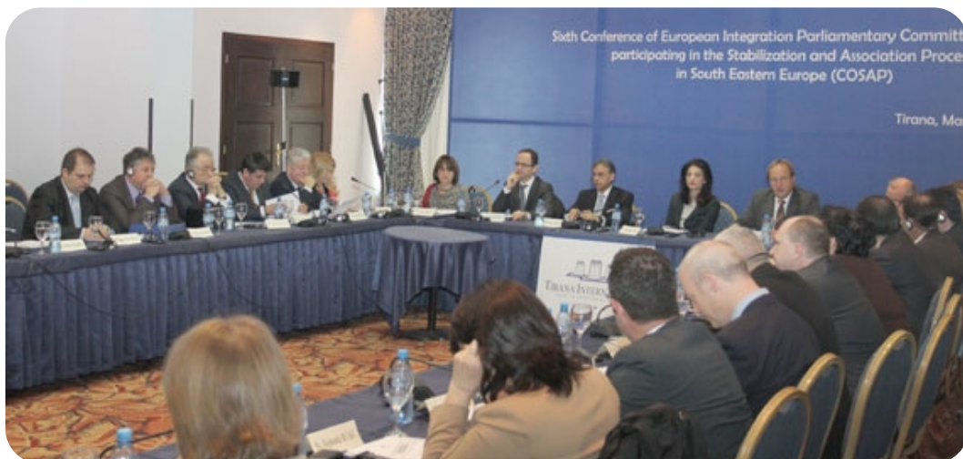
Slike sa rada konferencije (COSAP)

Dana 09.03.2012 u Tirani je održana Šesta konferencija parlamentarnih komisija za integraciju država, učesnica u procesu stabilizacije asocijacije.