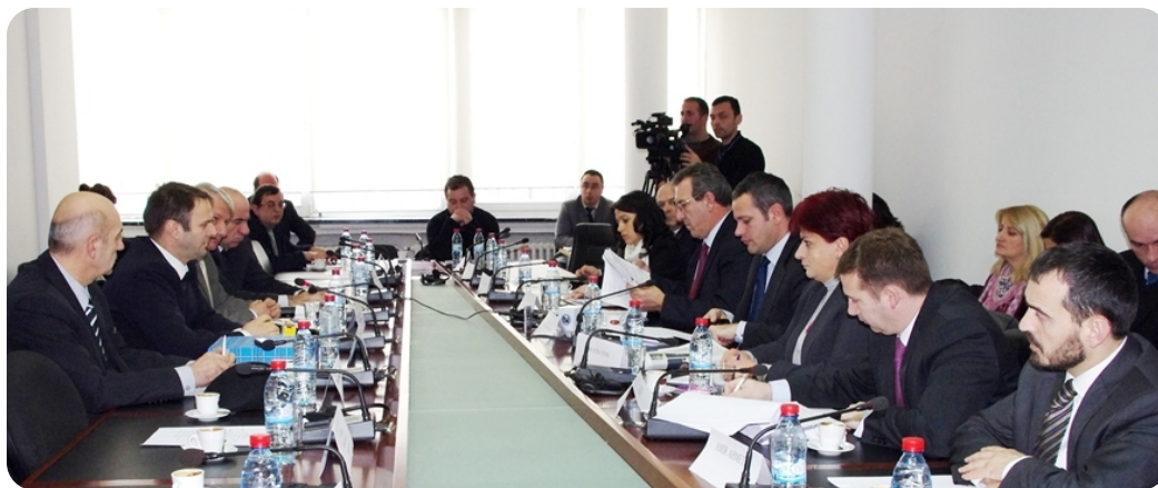
Javna rasprava Komisije za zakonodavstvo

Sve primedbe proizišlih tokom ove javne rasprave će se tretirati od strane Komisije, kako bi proizašli sa jednim boljim produktom, koji će biti primenjiv u zemlji.