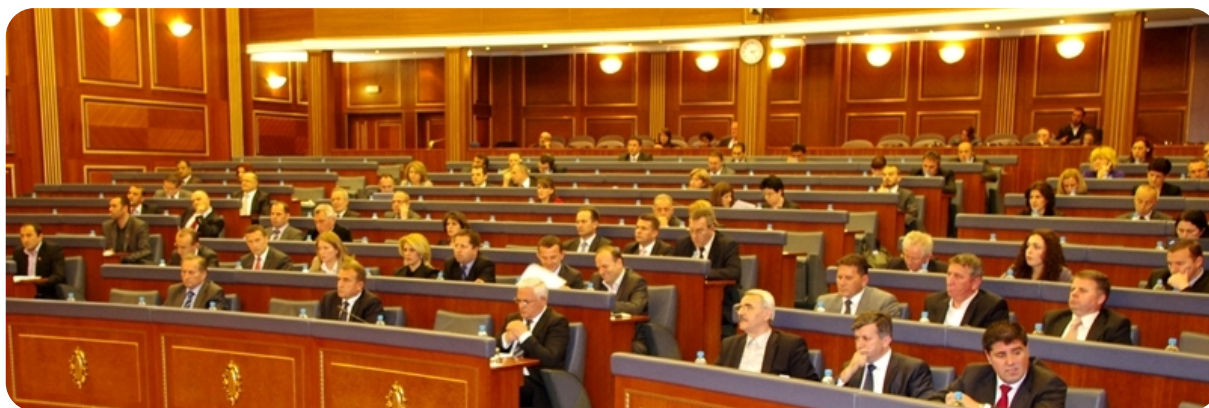
Slika iz sale tokom vanredne sednice

Brojni poslanici, iz redova svih parlamentarnih grupa, koji su govorili na sednici, složili su se o teškom stanju na severu zemlje, ali se razlikovali u njihovim stavovima o razlozima i uzročnicima tog stanja.