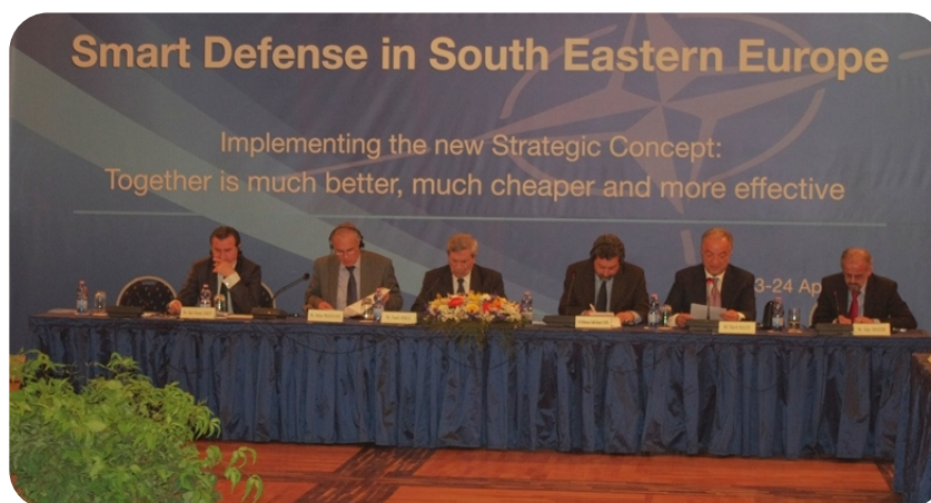
Konferencija Parlamentarne Asambleje NATO-a.

Tirana, 23. april. Pod organizacijom Skupštine Albanije, u saradnji sa Parlamentarnom Asamblejom NATO-a, u Tirani, počela trodnevna konferencija s temom: „Mudra odbrana – saradnja i regionalna koordinacija između zemalja Jugoistočne Evrope, prikupljanje i podela aseta odbrane“.