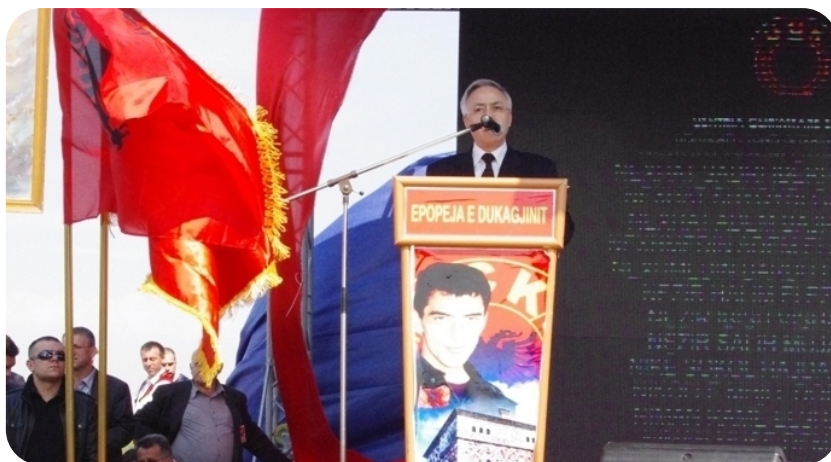
Reč predsednika Skupštine u manifestaciji “Epopa OVK-a u Dukađinu”.

Epopeje u Prekazu i Glođanu nadahnuli i mobilizirali borce za konačne pobedonosne borbe. Kao jučer u ratu i danas u miru, veliki zadaci prema zemlji se izvrše u jedinjenim snagama, jer ideal za domovinu je jedan.