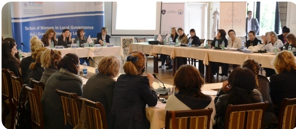
Slike sa rada konferencije

U prethodnim mandatima institucija putem sprovođenja rodne kvote stvoreni su uslovi koji su doprineli u uključivanje većeg broja žena u društvenim procesima