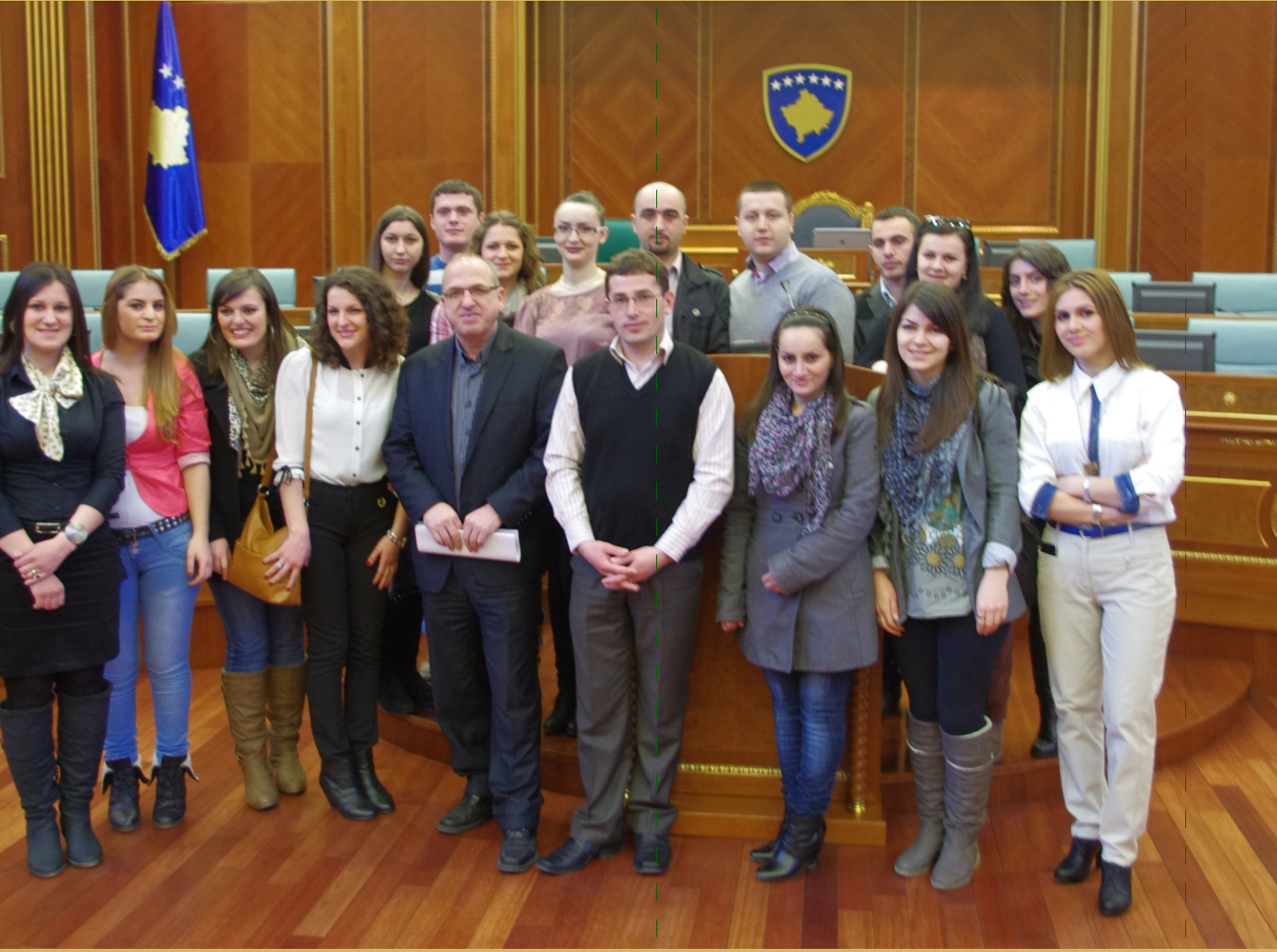
PR Üniversitesi öğrencilerinin Meclis'e yapmış oldukları ziyaretinden bir an