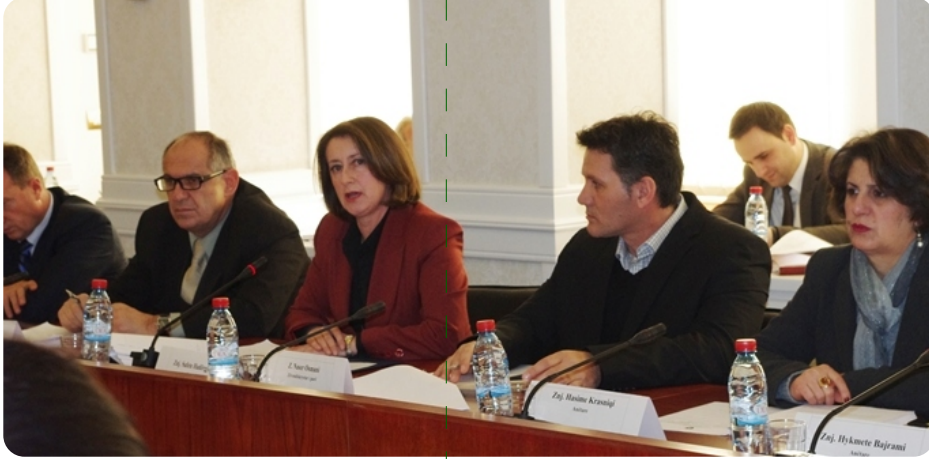
Açık oturumdan bir görüntü

Yasa tasarısının amacı, bankalar, mikro finans kuruluşları ve banka dışı mali kurumların lisans sahibi olması, denetlenmesi ve düzenlenmesidir