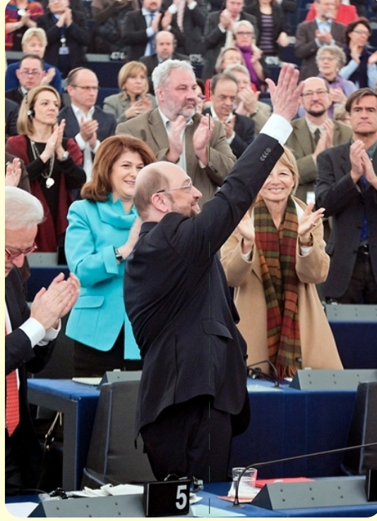
Martin Schulz seçilmesi sırasında