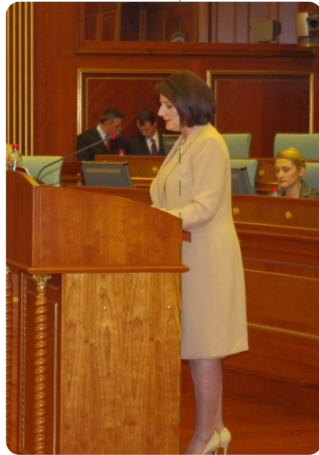
Cumhurbaşkanı Atifete Jahjaga