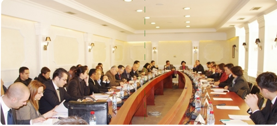
Açık oturumdan bir görüntü

Maliye Bakanı Bedri Hamza yasaı tanıtırken, bu yasanın hazırlıkları süresinde en iyi uluslararası standartların, bankaların düzenlenmesi ile ilgili denetleme alanında AB'nin standartları ve direktifleri ve bankacılığın etkili bir şekilde denetlenmesine yönelik Bazelin temel ilkelerinin esas alındığını söyledi. Hamza'ya göre son on yıl içerisinde banka sisteminin gelişmesinin ve bankacılığın denetim pratiğinin değişmelerin, bankalar, mikro finans kuruluşları ve banka dışı mali kurumlara ait yasanın çıkarılması taleplerini artırmıştır. Bu, 1999 yılından bu yana meydana gelen değişmelerin yansıması amacıyla yapılmıştır.