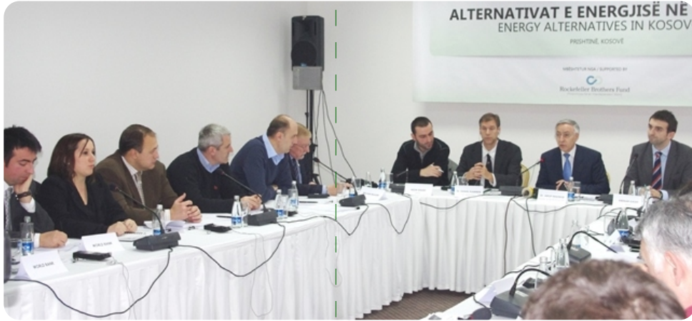
Toplantıdan bir görüntü

Enerji Kosova ekonomisinin kilit sektörüdür, özellikle ülkemizin sahip olduğu büyük linyit kaynak potansiyellerinden dolayı önemlidir. Mevcut senaryolara göre bizde enerji sektöründe KEK hâkimdir. Enerji üretiminin hemen hemen yüzde 90'ı linyitin yakılmasından elde edilmektedir.