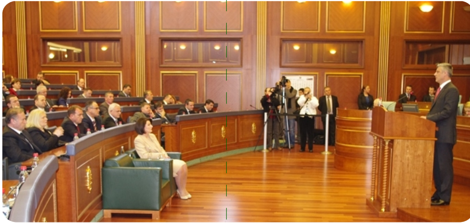
Başbakan Hashim Thaçi

Bu törenli toplantıda katılımcılara hitapta bulunan Kosova Başbakanı Hashim Thaçi, 17 Şubat 2008 yılının Kosova ve onun vatandaşları için doruk tarihi olaylardan biri olduğunu belirtti. “Düşlediğimizi hep birlikte gerçek yaptık”. Kosova Bağımsızlığının büyük bayramına varmamız için hep birlikte çalışarak, üstün çaba sarfettik. Bugün Cumhurbaşkanı Rugova, komutan Adem Jashari, tüm komutanları, askerleri,