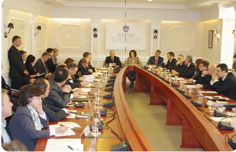
Rüşvete Karşı Ulusal Konseyi

Kosova toplumu ve Kosova kurumları, son yıllarda örgütlü suç işinin hiçbir çeşidine karşı gerektiği kadar savaşım veremedi