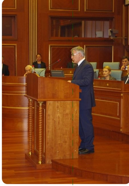
Meclis Başkanı Dr. Jakup Krasniqi

Kosova'nın kurtuluş savaşından sonra, NATO'nun askeri varlığı Balkanlarda yeni bir gerçeği sağlamış oldu.