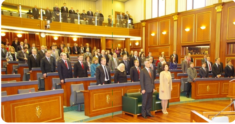
Salondan bir görüntü

Bağımsızlığının bu dört yılı içinde Kosova demokratik devletin konsolidasyonunun kurulması doğrultusunda önemli adımlar atmıştır ABD, AB ve NATO'ya üye olan ülkeler gibi tüm uluslararası komşularımız takdir edildi