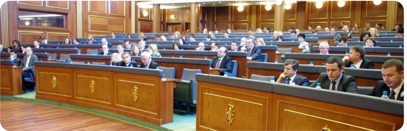
Salondan bir görüntü