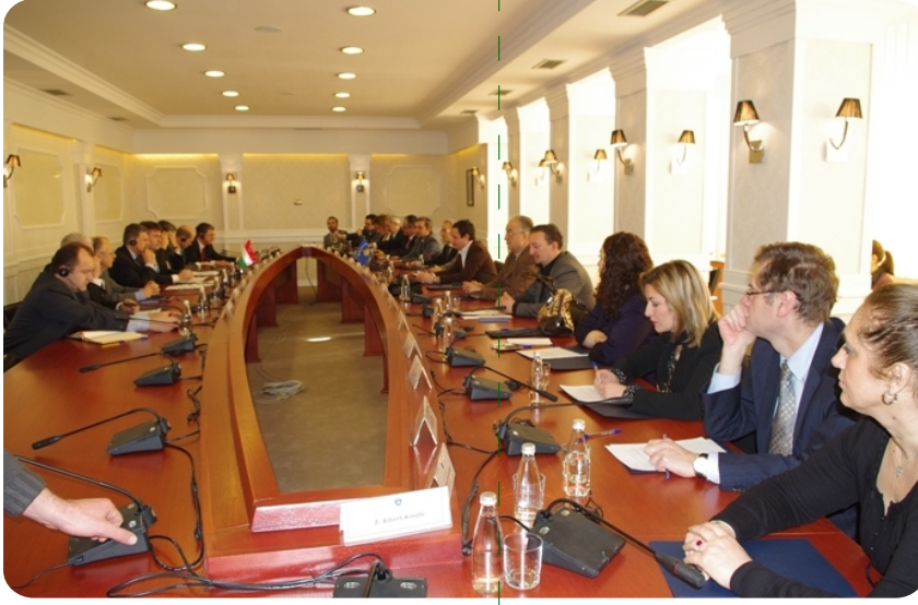
Laszlo KÖVER'in parlamento komisyonu ile görüşmesi

Dışişleri Komisyonu Başkanı Albin Kurti, ülke bağımsızlığının ilan edilmesinden sonra, Kosova devletini tanıdığından dolayı Macaristan devletine teşekkürlerini sundu. Bu görüşme sırasında Kurti, yeni devlet olarak Kosova'nın ekonominin yeterince gelişmediği ve ülkede fakirlik ile işsizliğin arttığından dolayı çok sayıda zorluklarla karşı karşıya geldiğini belirtti. Onun sözlerine göre, ekonomi gelişme eksikliği yanı sıra, büyük politik sorunu da mevcuttur. "Yöremizin çeyreği Sırbistan'ın illegal ve düşmanca strüktürleri tarafından sarılıdır ve onların amacı Kosova için Bosna modelini istediklerini beyan ederek, Kosova devletini çalışmaz hale getirmek ve başarısız kılmaktır", dedi Kurti.