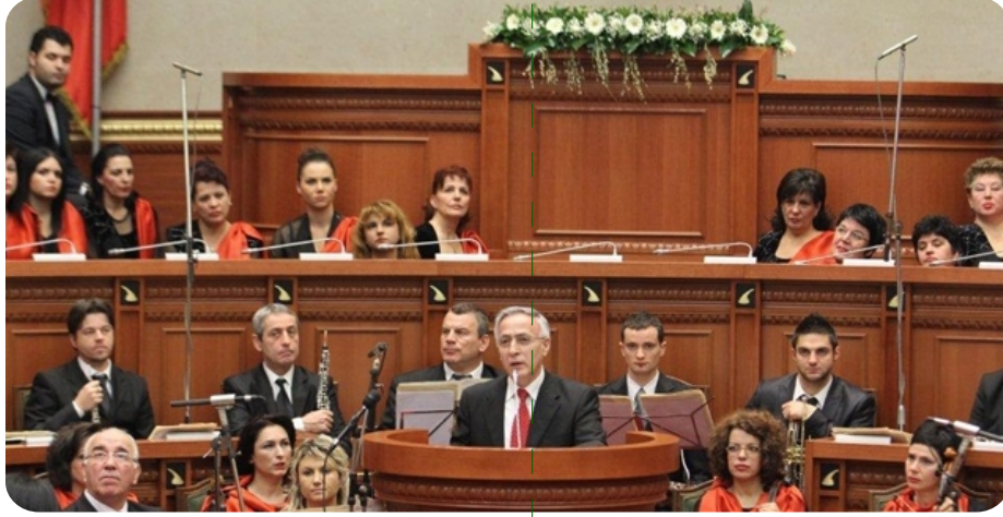
Kosova Meclis Başkanı Jakup Krasniqi, Arnavutluk Meclisi'nde

Formülü, yüzyıl tamamlanmadıktan önce tekrar ortaya çıktı: " Demokratik şekilde seçilmiş olduğumuz halkın yöneticileri olarak bizler, bu Deklarasyon sayesinde Kosova'yı, bağımsız ve egemen devlet olarak ilan ediyoruz". Bu formül özellikle 17 Şubat 2008 tarihinde telaffuz edilecektir.