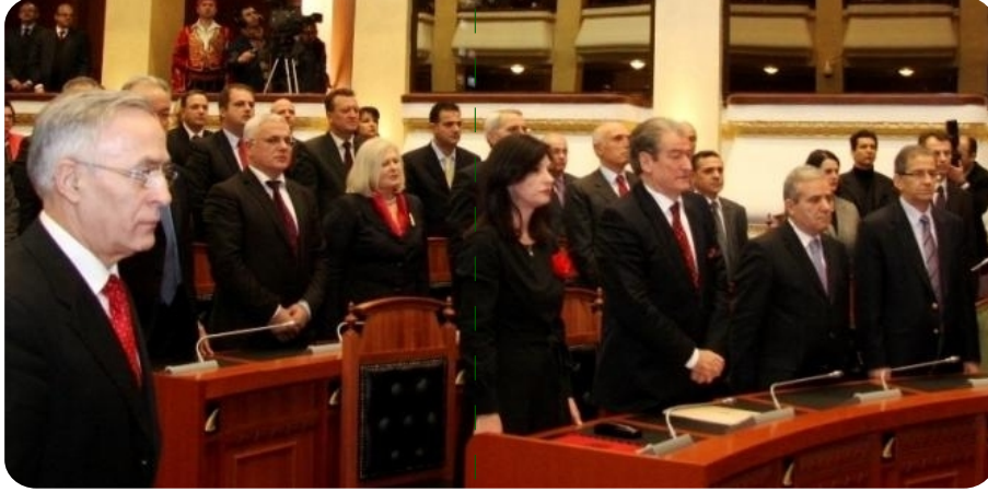
Arnavutluk Meclisi salonundan bir görüntü

Sayın Arnavutluk Meclisi Başkanı Topalli, Sayın Cumhurbaşkanı Topi, Sayın Başbakan Berisha, Sayın bay ve bayan Milletvekilleri, Sayın dünyanın her yerinde yaşayan Arnavutlar,