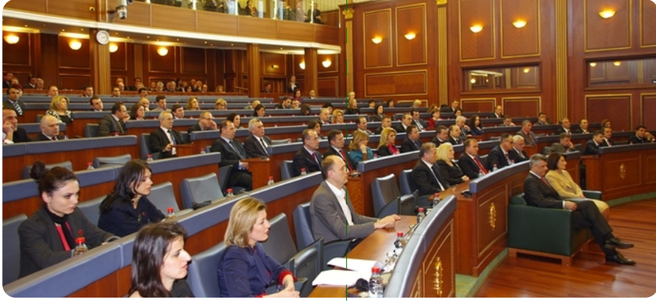
Salondan bir görüntü

Avrupa Birliği sadece politik mekanizması değildir, herşeyden önce değerler sisteminin birleşmesidir. Böylece toplum ile Kosova devleti o değerleri, o vizyonu ve Avrupalılaşan Kosova'nın kurulmasını amaçlamaktadır. Kosova'nın her vatandaşı, bu vizyonun gerçekleşmesine katkı sunduğundan dolayı kendini iyi ve gururlu hissetmelidir.