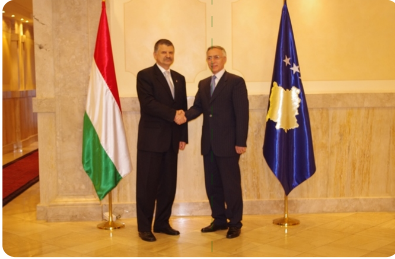
Laszlo KOVER ile görüşmeden bir an

Macaristan Ulusal Meclisi Başkanı Sayın Laszlo KÖVER'in ziyareti çerçevesinde, Kosova Meclisinde , Avrupa Birliđi tarafından finanse edilen ve Kosova'daki Avrupa Komisyonunun Eřgüdüm Bürosu tarafından yönetilen Kardeřlik Projesinin açılması münasebetiyle resmi tören düzenlendi, bu proje özellikle Macaristan Ulusal Meclisi tarafından onaylanacaktır.