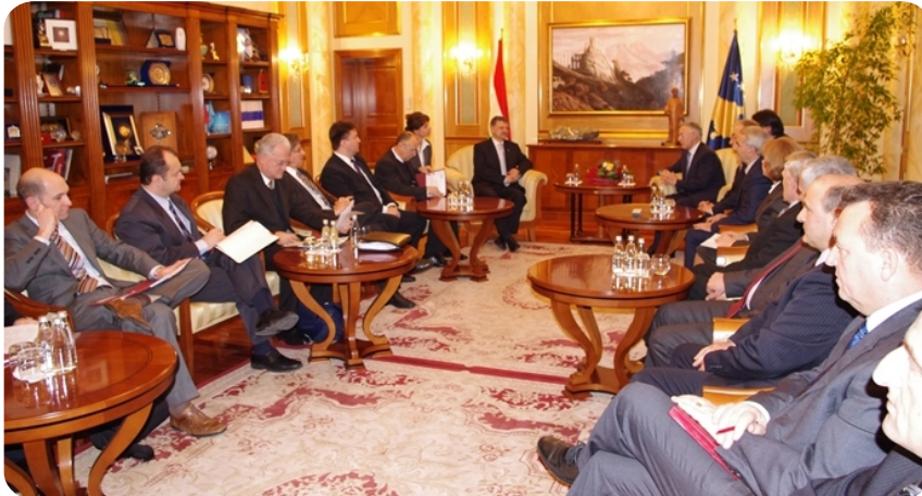
Susret sa Laszlo KOVER

Predsednik Skupštine Republike Kosova dr Jakup Krasnići primio je predsednika Nacionalnog parlamenta Mađarske g-dina Lasla Kovera Poželevši dobrodošlicu na Kosovu homologu iz Mađarske - Kövéru, predsednik Krasnići je podsetio na istorijsku saradnju dveju država, ubeđen da će se ista ojačati i produbiti. On je cenio stalnu podršku Mađarske Kosovu, posebno od vremena predsedavanja EU-om, godinu dana ranije, kao i konzistentnu politiku Mađarske za proširenje EU-a.