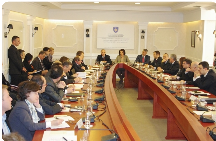
Nacionalni savet protiv korupcije

Kosovsko društvo i institucije tokom ovih godina nisu uspjeli da suzbijaju na potrebnom stepenu ni jednu formu organizovanog kriminala