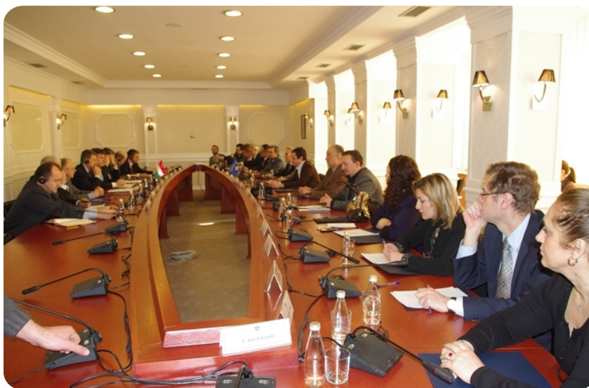
Susret Laszlo KOVER sa parlamentarnim komisijama

Predstavnici Komisije za spoljne poslove i Komisije za evropske integracije Skupštine Kosova, sastali su se sa predsednikom Skupštine Mađarske g-dinom Lászlóm KÖVÉROM.