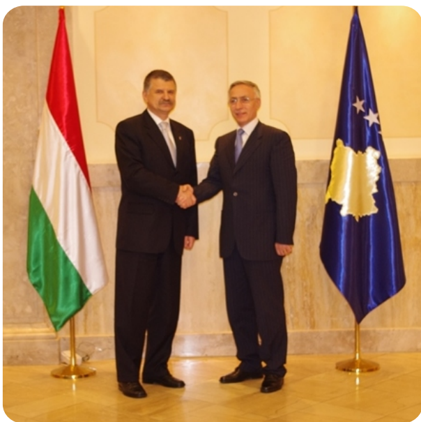
Susret sa Laszlo KOVER

U okviru posete predsednika Nacionalne skupštine Mađarske g-dina Lászla KÖVÉRA , danas je u Skupštini Kosova organizovana službena ceremonija otvaranja Projekta bratimljenja, finansiranog od EU i menadžiranog od Kancelarije za vezu Evropske komisije na Kosovu, koji će sprovesti Nacionalna skupština Mađarske.