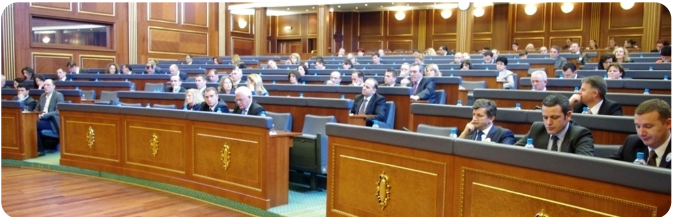
Pogled iz sale