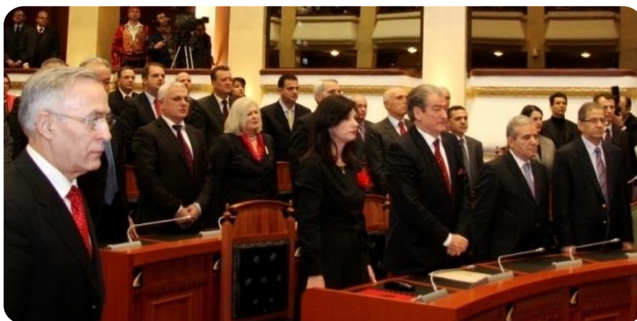
Pogled iz sale u Skupštini Albanije

Poštovana predsednice Skupštine Albanije gospođo Topali, Poštovani predsedniče Topi, Poštovani premijeru Beriša, Poštovani poslanici i poslanice, Albanci ma gde god se nalazili,