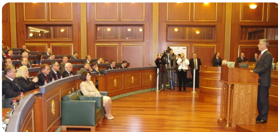
Premijer, Hashim Taçi