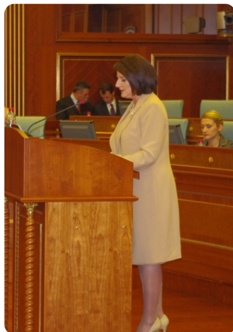
Predsednica, Atifete Jahjaga