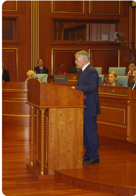
Predsednika Skupštine, Jakup Krasniqi

Nakon Oslobodilačke borbe Kosova, vojno prisustvo NATO-a je dovelo do jedne nove stvarnosti na Balkanu. Odlučnost ove značajne institucije globalne sigurnosti, da ne dozvoljava ponavljanje tragične istorije, odigrava veliku ulogu u iskorenjivanju svih ratohuškačkih tendencija u našem regionu.