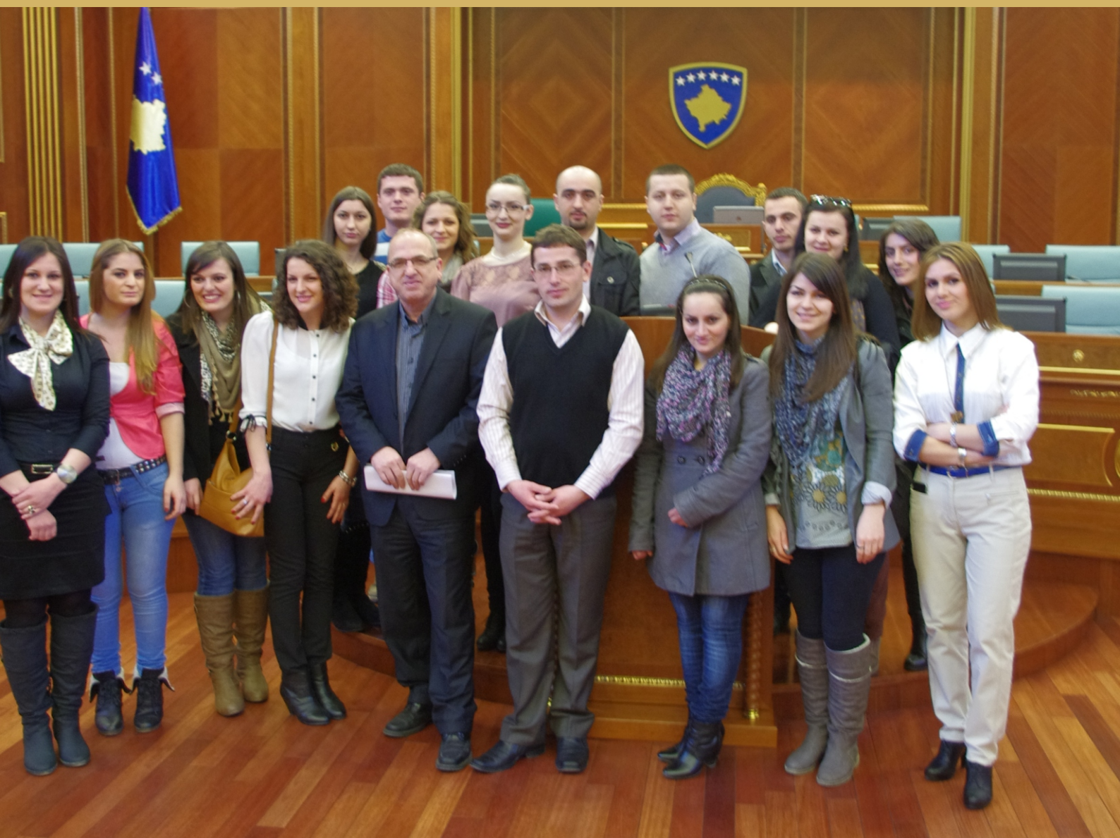
Poseta studenata PU-a, Pravni fakultet, u Skupštine