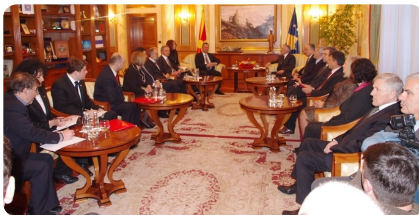
Susret sa Trajko Veljanoskim

U nastavku, predsednik Skupštine Kosova se zadržao i na dobrosusedstvu koje gaji Kosovo sa svim njegovim susedima, izuzev Srbije, koja nastavlja da ne priznaje realnost na Kosovu.