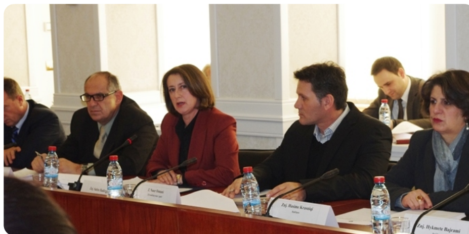
Pogled sa javne rasprave

Nacrt zakona ima za cilj izgradnju moderne infrastrukture za licenciranje, nadzor i uređivanje banaka, mikrofinansijskih i nebankarskih finansijskih institucija.