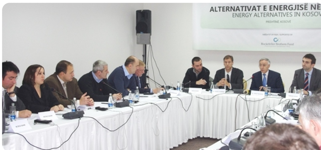
Pogled iz konferencije

konferencija, osim što će tretirati jedno od veoma značajnih pitanja, kao što su obnovljivi izvori energije, rezultirati i preporukama koje će ohrabriti privatne investicije u sektoru energije. Energija je ključan sektor za privredu Kosova, posebno zbog velikih potencijala izvora lignita koje ima naša zemlja. Prema aktuelnim scenarijima, energetski sektor kod nas je doniran od KEK-a. Skoro 90% proizvodnje električne energije je od sagorevanja lignita.