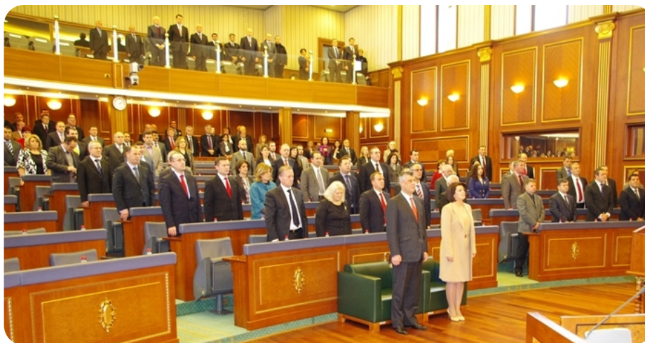
Pogled iz sale

Duboko priznanje za sve naše međunarodne prijatelje, SAD, EU i zemlje – članice NATO-a