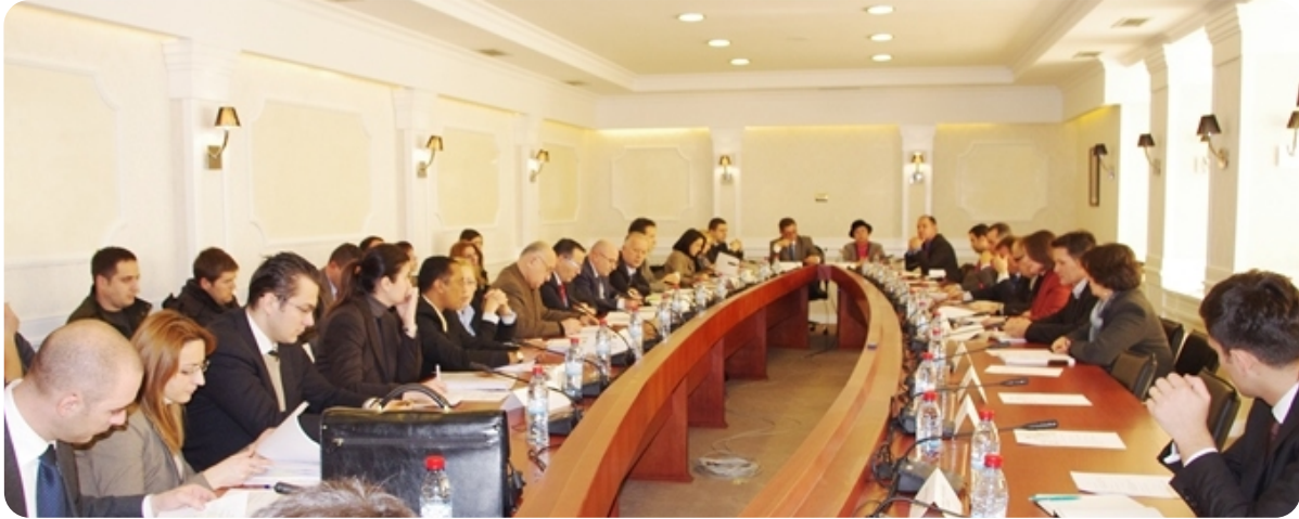
Pogled sa javne rasprave

Ministar finansija Bedri Hamza, prezentirajući Zakon, istakao je da su tokom njegove izrade uzeti u obzir najbolji međunarodni standardi, standardi i direktive EU u oblasti nadgledanja bankarskog sistema kao i osnovna načela Bazela za efikasno bankarsko nadgledanje. Razvoj bankarskog sistema tokom 10 zadnjih godina na Kosovu i promene u praksi bankarskog nadgledanja, povećali su zahtev za donošenje novog zakona o bankama, mikrofinansijskim i drugim nebankarskim finansijskim institucijama, u cilju reflektovanja promena od 1999 .godine do sada.