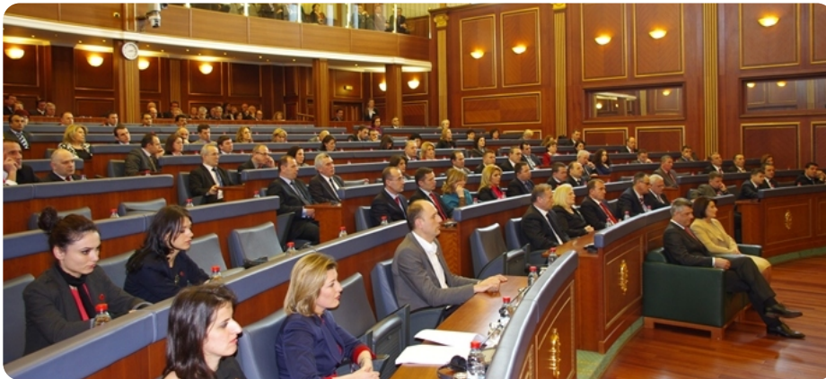
Pogled iz sale

Evropska unija nije samo politički mehanizam, nego je iznad svega unija sistema vrednosti. Takođe, kosovsko društvo i država teži istim vrednostima, istoj viziji, izgradnji evropskog Kosova. Svaki građanin Kosova treba da se oseća dobro i ponosnim za njegov doprinos u ostvarivanju ove vizije.