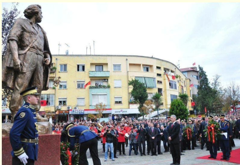
Adem Jashari, Tirana