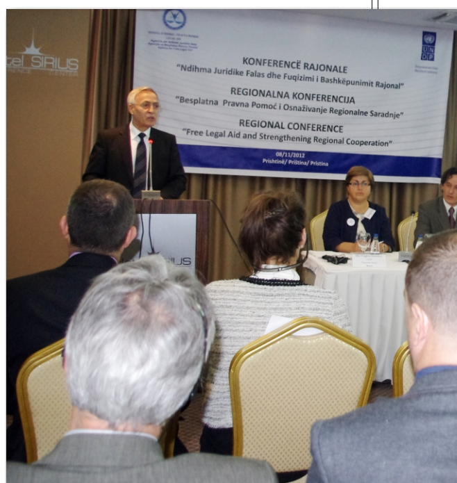
Pamje nga Konferenca

kojim se demokratije obavezuju da će se zalagati za rešavanje međunarodnih problema ekonomske, socijalne, kulturne i humane prirode, kao i za podršku i jačanje poštovanja osnovnih ljudskih prava i sloboda svih, bez razlike na rasu, pol, jezik ili versku pripadnost. U Evropskoj konferenciji o osnovnim ljudskim pravima i slobodama i njenim protokolima, takođe se utvrđuje da svako lice okrivljeno za krivično delo „treba da se samo brani ili da ga brani njegov