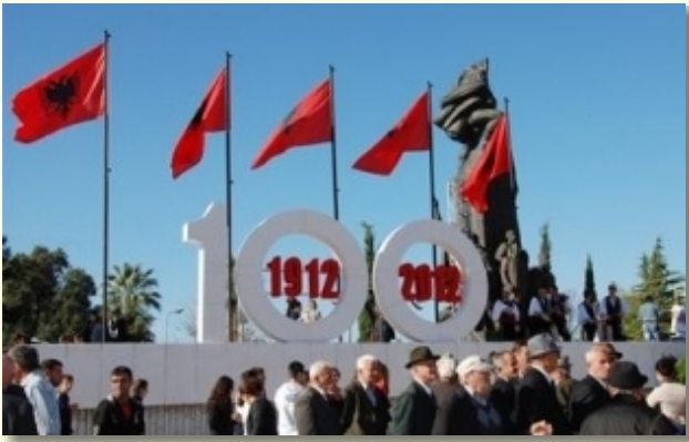
“Sheshi Flamurit”, Vlorë