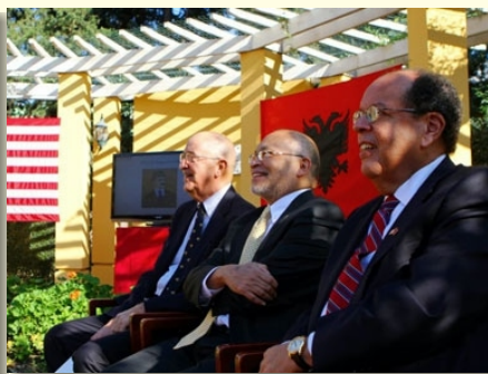
Tri bivša američka ambasadora