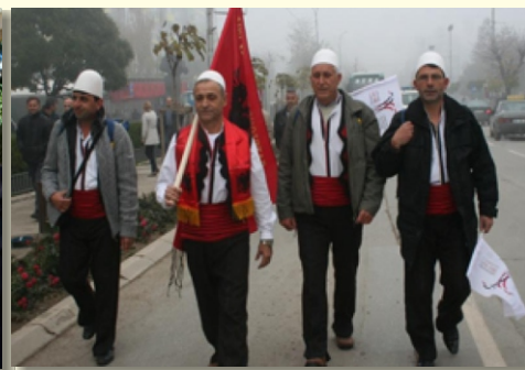
Peške kao pre 100 godina