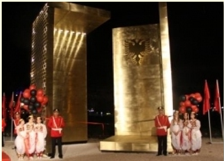
Spomenik 100 godišnjice proglašenja nezavisnosti