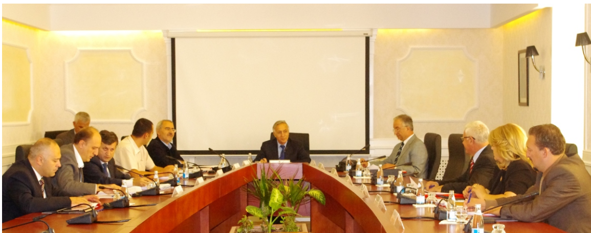
Sa sednice Predsedništva Skupštine

Izdaje: Direkcija za medije i odnose s javnošću Prevod: Direkcija za jezičke usluge