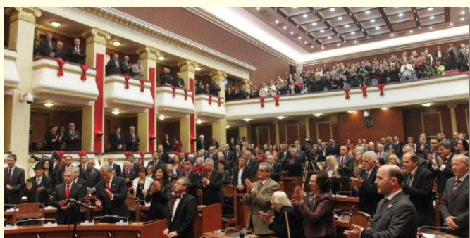
Ceremonija u Skupštini Albanije