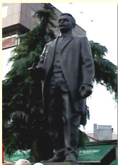
Hasan Prishtina, Skoplje