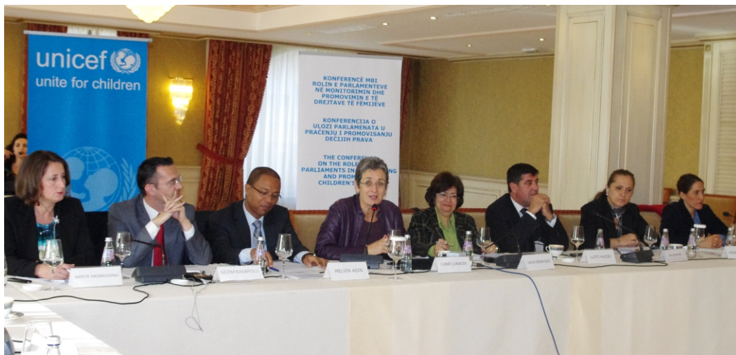
Pamje nga Konferenca

Evropske unije i razvojne procese koji Kosovo vode bliže evropskoj porodici.