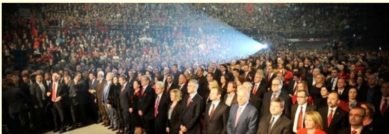
Sa veličanstvene manifestacije u Makedoniji