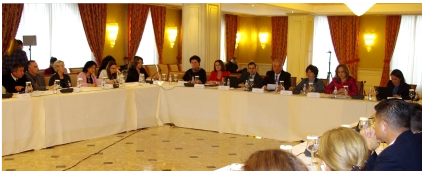
Pamje nga Konferenca

Poštovane kolege poslanici, Poštovani ministri i zamenici ministara, Poštovani pozvani gosti, domaći i međunarodni, Poštovani razvojni partneri Skupštine Kosova, Poštovani predstavnici civilnog društva i medija, Dame i gospodo,