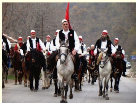
Konjima sa Kosova