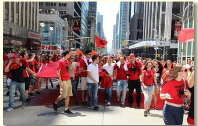
U Nju Jorku