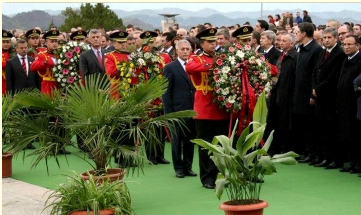
Postavljanje spomen venca u toku zvanične ceremonije