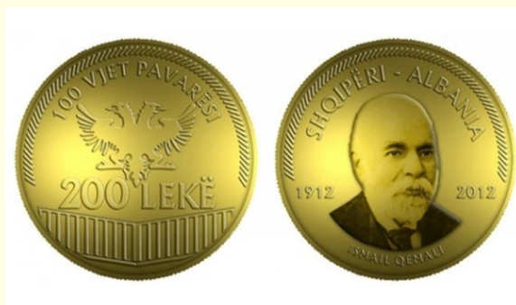
Kovanica od zlata povodom 100 godišnjice