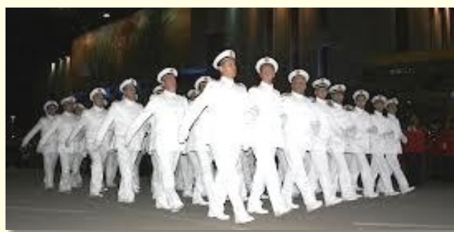
Prikaz sa parade