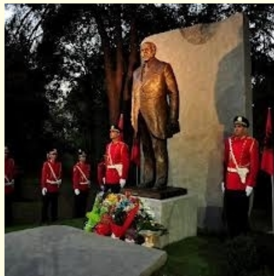
Spomenik Ismail Qemalit, Tirana