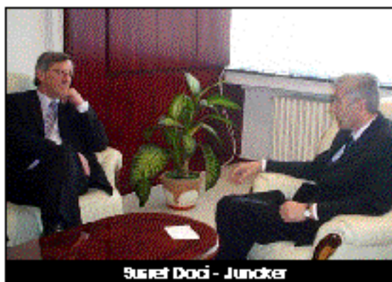
Susret Daci - Juncker

JUNCKER: Treba ići putem Rezolucije 1244 OUN i saradnje domaćih i međunarodnih institucija.