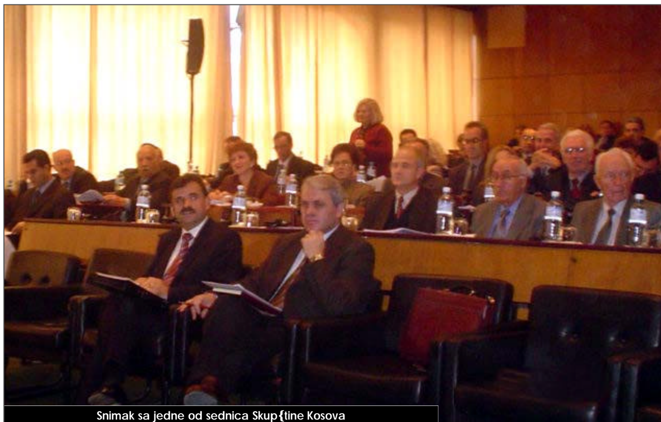
Snimak sa jedne od sednica Skupštine Kosova

podržavamo inicijativu i smatramo da je ovo dan kada treba pokrenuti inicijativu i postupak za neophodne izmene postojećeg Ustavnog okvira, kako bi funkcionisao ukupan život na Kosovu, što je neophodno za građane Kosova. O tome postoji i odgovarajuća regulativa. Član 14. Ustavnog okvira Kosova daje mogućnost pokretanja te procedure. Takođe, Poslovnikom Skupštine Kosova smo vrlo precizno utvrdili način i metode mogućih izmena. Konano, mi smo imali izmene Ustavnog okvira i ranije, tako da ovo nije nikakav presedan.