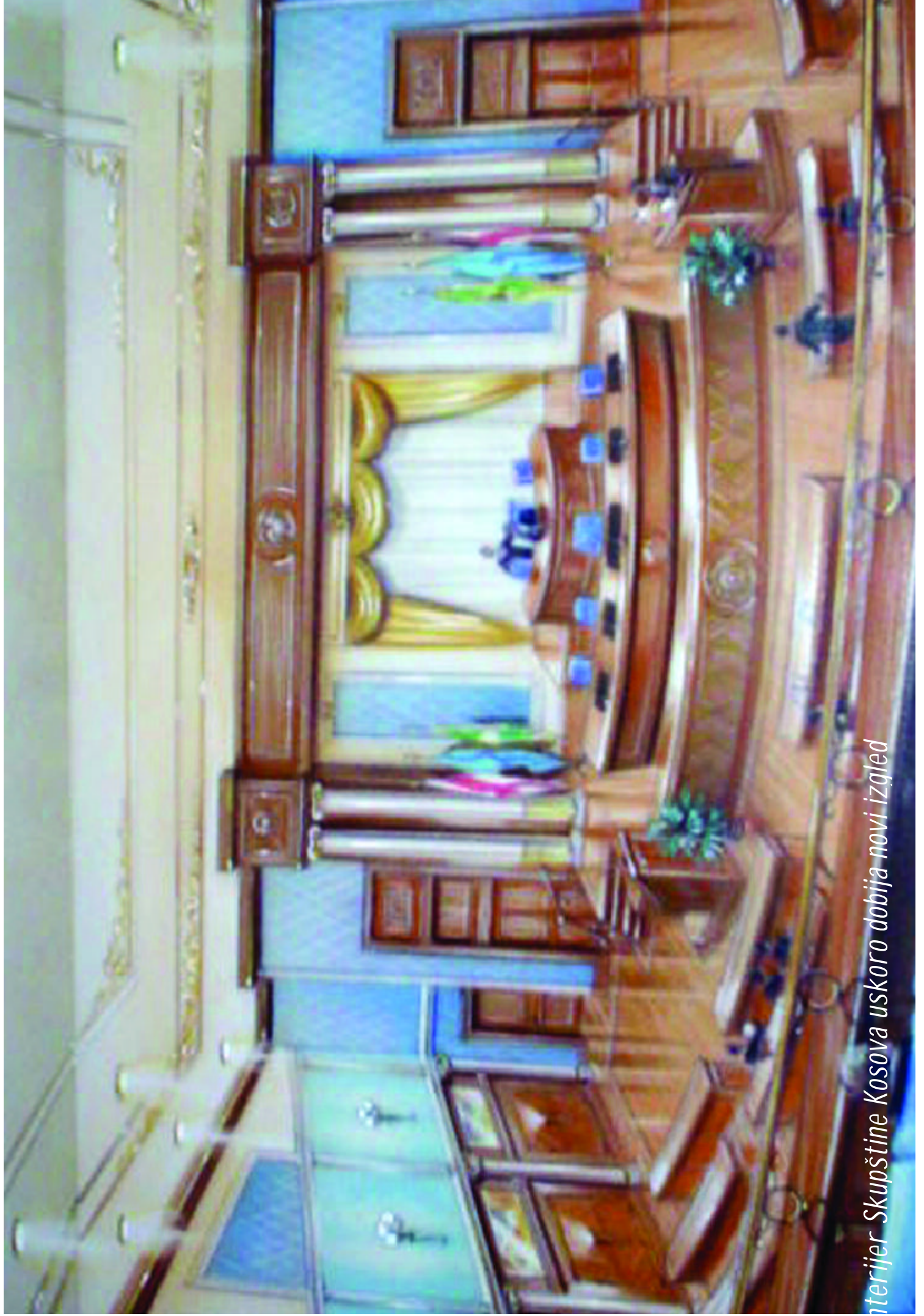
Interijer Skupštine Kosova uskoro dobija novi izgled