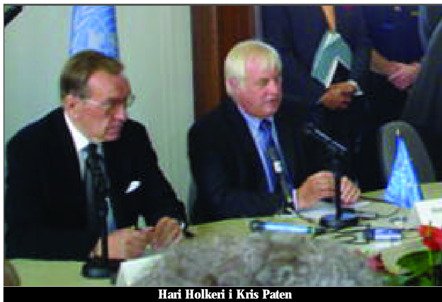
Hari Holkeri i Kris Paten

dravio visoke goste i prisutne, govorio je o izazovima koji prate rad Kosovskog parlamenta, o punoj i istinitoj posvećenosti Skupštine Kosova i naroda Kosova za demokratske razvoje na Kosovu, o doprinosu miru na Kosovu i u regionu. On je, nakon što je izrazio zadovoljstvo Skupštine Kosova o zajedničkim