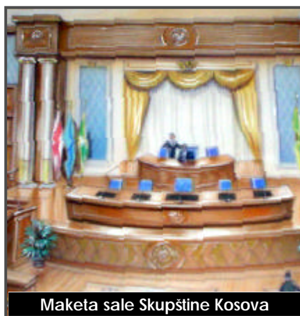
Maketa sale Skupštine Kosova

E nterijer Skupštine Kosova pridobija nov izgled. Još od kraja jula ove godine, radnici firme "Mabetex Group" su zapo-eli radove u obnovi sale, hola i ulaza zgrade Skupštine Kosova. Renoviranje enterijera zgrade Skupštine Kosova, izmedju ostalog, obuhvata elektronske instalacije, ozvu-enje, grejanje, klimatizaciju i neke druge poslove. O-ekuje se da se, po završetku radova, stvaraju optimalni uslovi za rad svih organa Skupštine Kosova. Osim jednog lepšeg izgleda, poslanici i zaposleni pri Skupštini Kosova }e, svakako, imati na raspolaganju daleko funkcionalniji ambijenat nego do sada, u svim