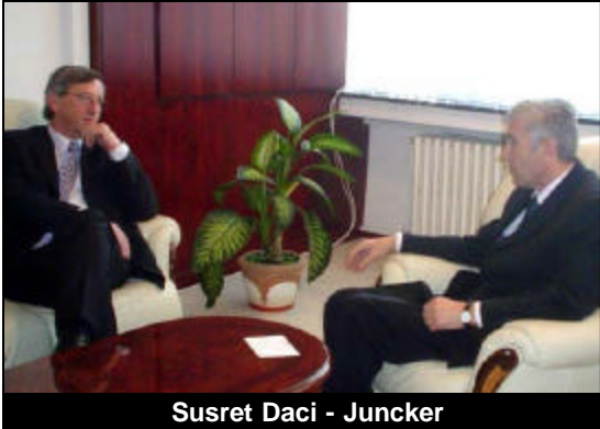
Susret Daci - Juncker

DACI: Imamo humane i prirodne resurse da rukovodimo Kosovom.