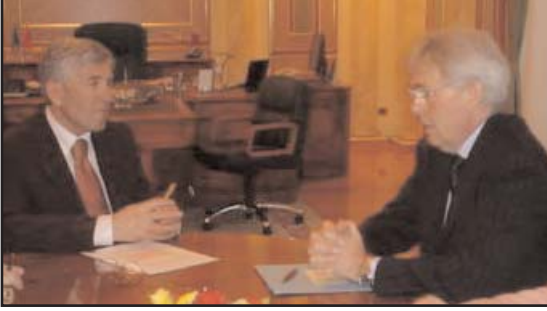
Daci-Petersen görüşmesinden bir an

Kabul sırasında, Sırbistan Başkanı Tadiç'in ziyareti ve Kosova'ya ait standartların yerine getirilmesi yönündeki çalışmalar hakkında konuşuldu