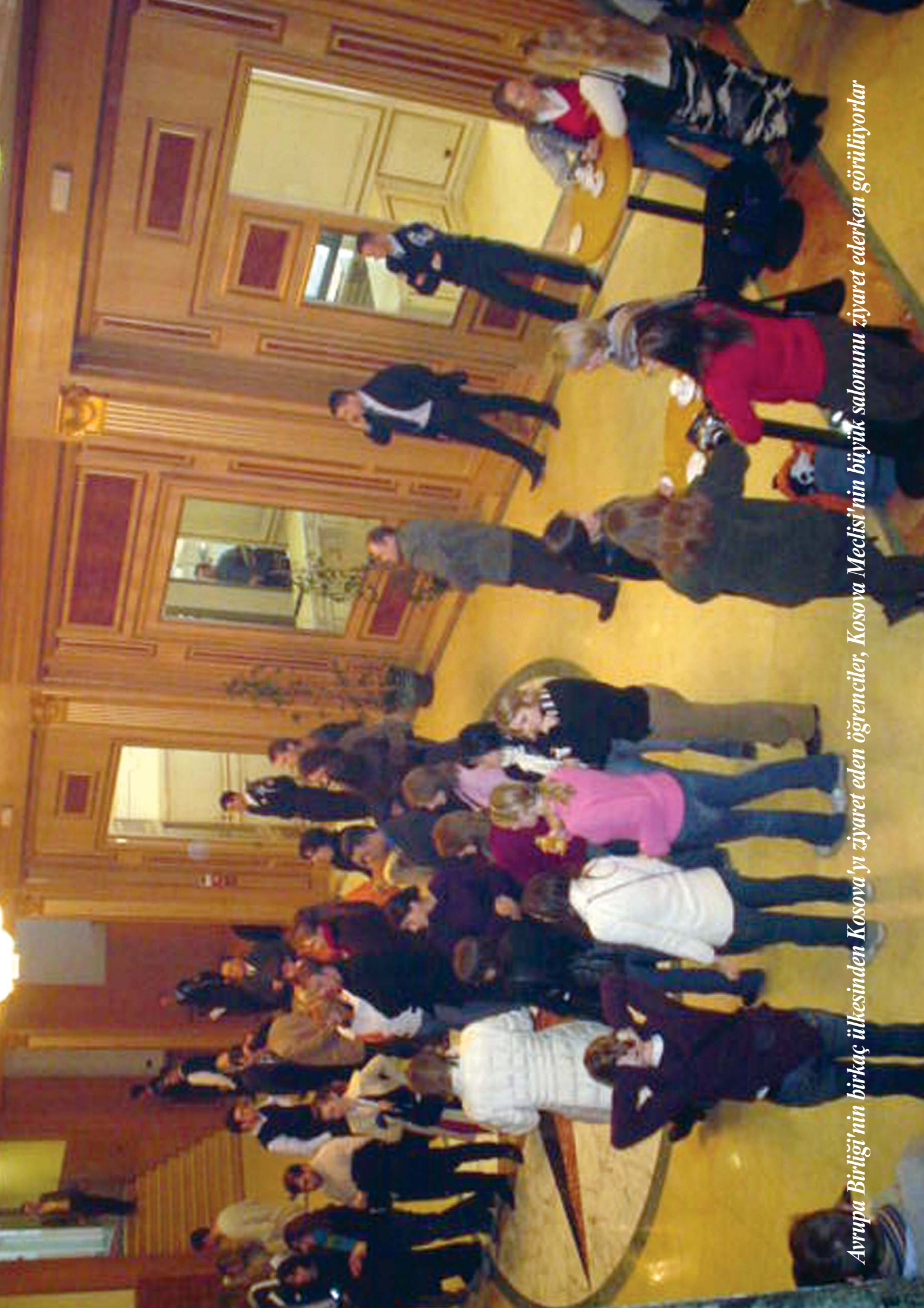
Avrupa Birliđi'nin birkaç ülkesinden Kosova'yı ziyaret eden öğrenciler, Kosova Meclisi'nin büyük salonunu ziyaret ederken görülmüyorlar