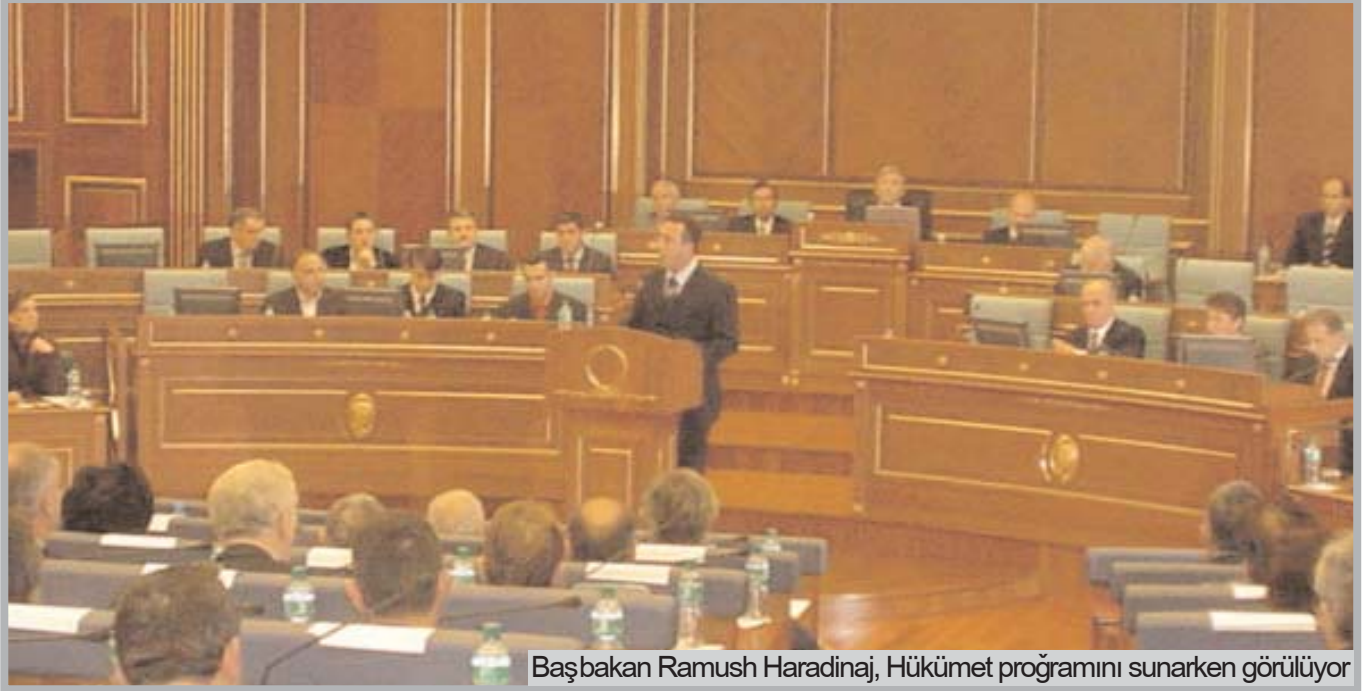
Başbakan Ramush Haradinaj, Hükümet programını sunarken görülüyor

Hükümet programı, Kosova yurttaşlarının politik isteğiyle uyumlu olarak final statüyle ilgili karar almayı sağlayarak, Kosova'ya süreçte devlet yapma çabasında bulunmaktadır