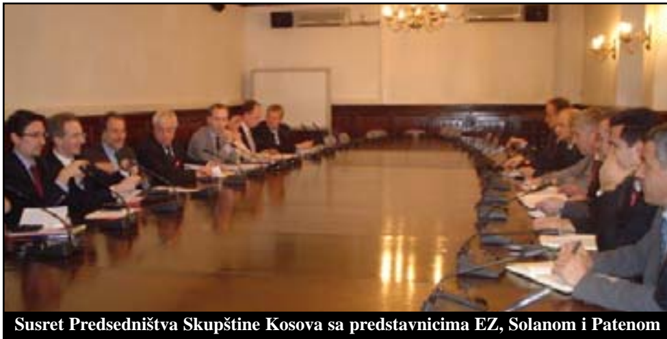
Susret Predsedništva Skupštine Kosova sa predstavnicima EZ, Solanom i Patenom

Srpski predstavnici u Predsedništvu istakli da institucije Kosova nisu spremne da prihvate odgovornost za nasilan revolt, a godišnjicu intervencije NATO-a na Kosovu ocenili jubilarom godinom etničkog čišćenja Srba. SOLANA: Iz ovog susreta izlazim veći pesimista nego što sam došao