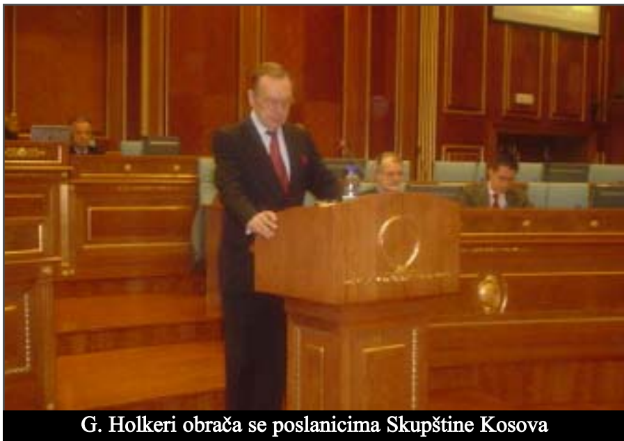
G. Holkeri obraća se poslanicima Skupštine Kosova

Znam da ovo nasilje nije bilo delo celokupnog društva. Bilo je delo jedne male grupe ljudi koji imaju svoj plan za Kosovo. Njihov plan je Kosovo kojim će oni upravljati nasiljem i pretnjom, držeći celokupno stanovništvo Kosova kao taoce za njihove ciljeve. Njihov plan ne prihvata demokratiju, odbija vladanje zakona, negira bogato kulturno nasleđe Kosova i etničku mnogovrsnost, ne omogućava ekonomski razvoj, on obećava da Kosovo bude siromašno u Evropi, rekao je Holkeri.