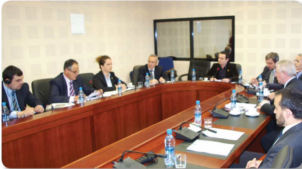
Komisioni për Punë të Jashtme