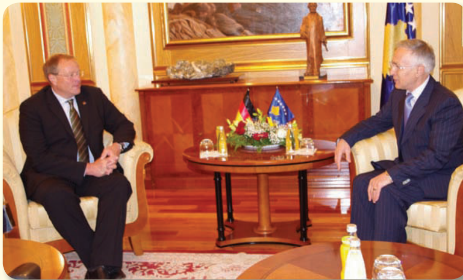
Krasniqi - Niebel

Kryetari i Kuvendit të Republikës së Kosovës, dr. Jakup Krasniqi, priti një delegacion të Republikës Federale të Gjermanisë, i kryesuar nga z. Dirk Niebel, ministër për Bashkëpunim dhe Zhvillim Ekonomik. Në takim është biseduar për thellimin e bashkëpunimit ndërmjet dy vendeve.