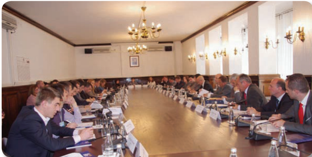
NDI - Kryetarët e Grupeve Parlamentare dhe administrata

Strategjia Legjislative e Qeverisë, për vitin 2011, përmban 148 projekt-ligje