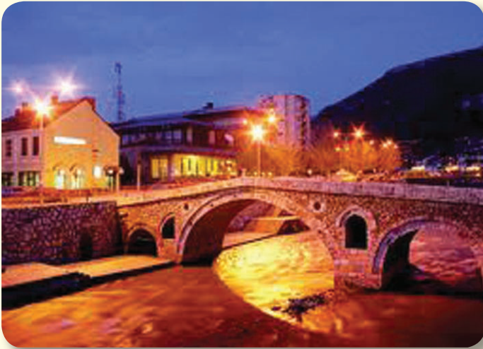
Ura e Prizrenit