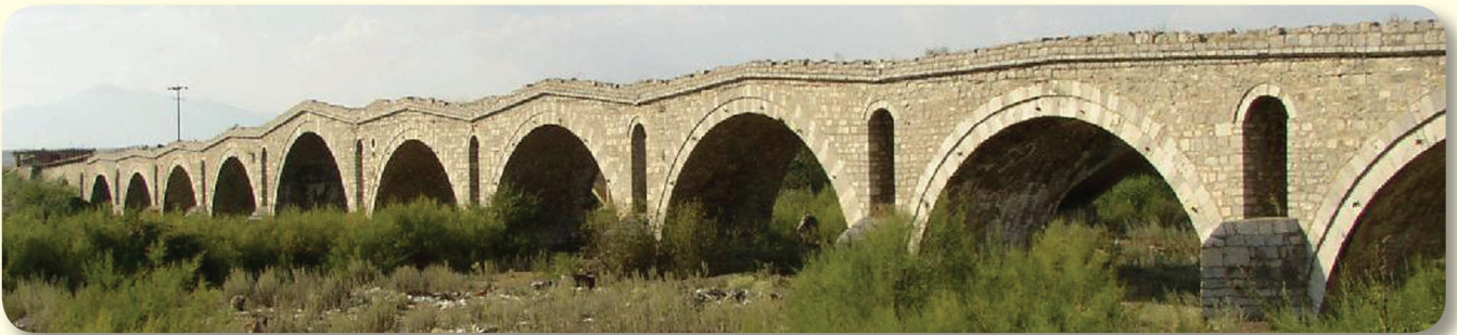
Ura e Vushtrrisë