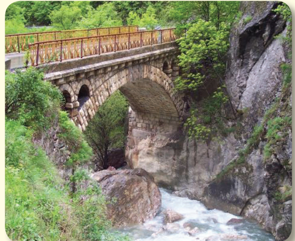
Ura e Rugovës