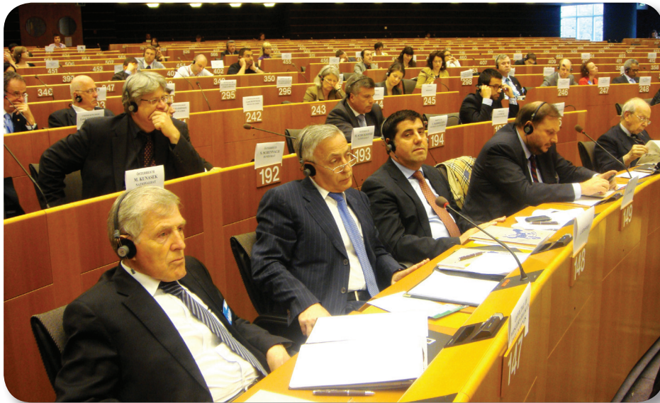
Nga seanca në Parlamentin Evropian

Para disa ditësh në Prishtinë u mbajt takimi i Asociacioneve të Kolegjeve Policore Evropiane (AEPC). Qendra e Kosovës për Siguri Publike, Edukim dhe Zhvillim është pranuar aty nga Bordi Qeverisës i AEPC, në cilësi të anëtarit vëzhgues.