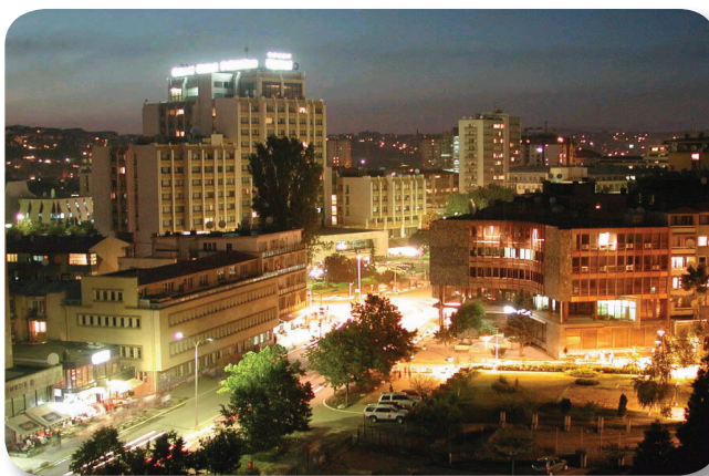
Pamje nga Prishtina