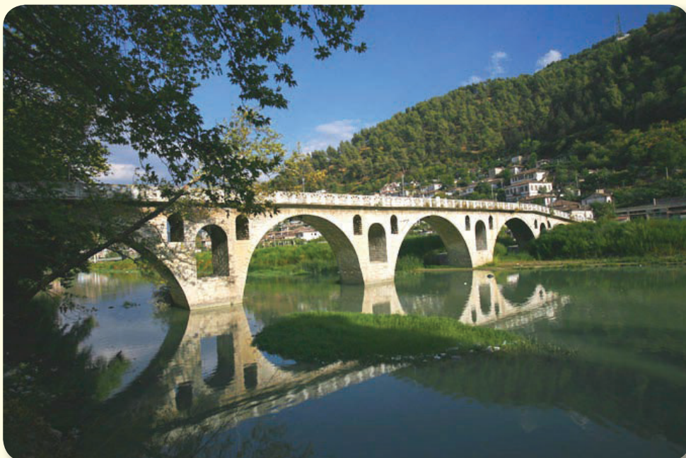
Ura e Goricës Berat