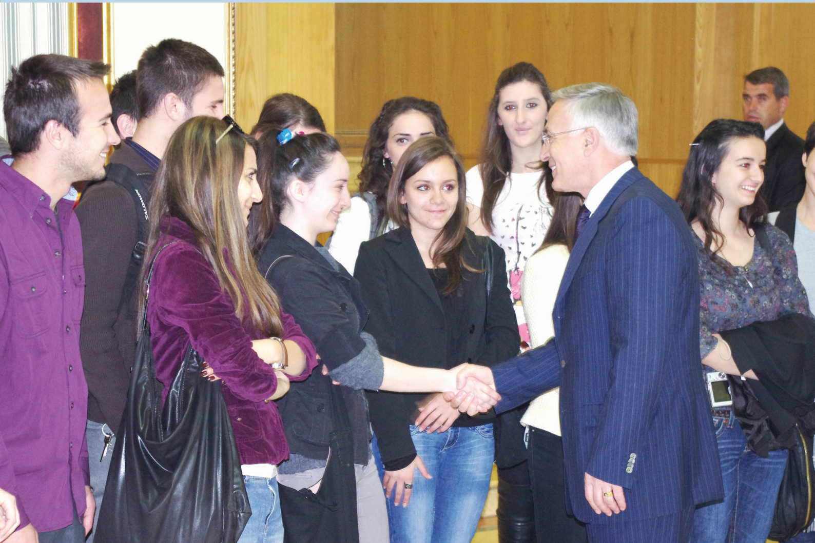
Kryetari i Kuvendit, pret nje grup nxënësish të gjimnazit “Sami Frasheri” Prishtinë