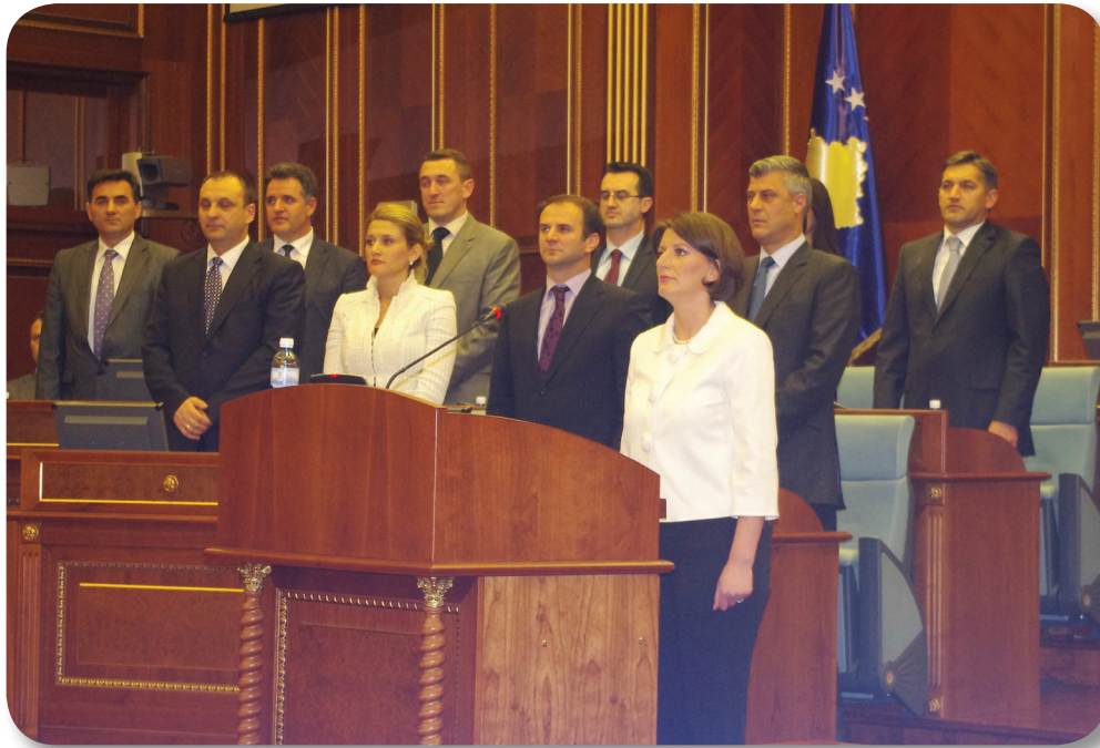
Presidentja Jahjaga në momentin e betimit

Pas vendimit të Gjykatës Kushtetuese se zgjedhja e Presidentit të Kosovës në mbledhjen e mbajtur më 22 shkurt ka qenë antikushtetuese, sot në një mbledhje të jashtëzakonshme, Kuvendi i Kosovës përsëri procedoi zgjedhjen e Presidentit.