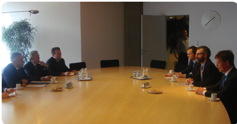
Takimi i delegacionit të Kuvendit të Kosovës në Ministrinë e Jashtme