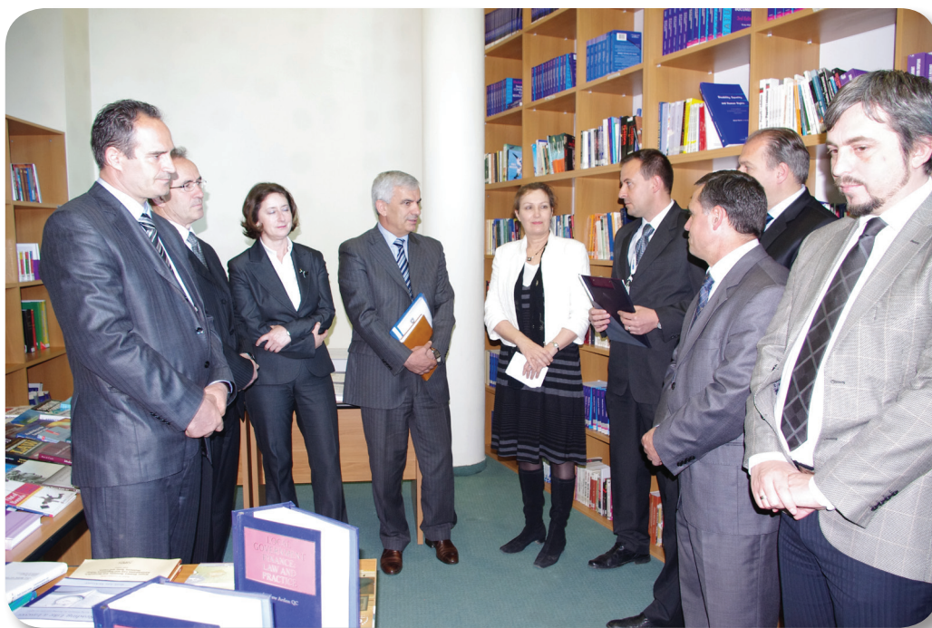
OSBE - Deputetet dhe Sekretari i përhershëm i Kuvendit të Kosovës

OSBE-ja partner mbështetës në vazhdimësi i Kuvendit të Kosovës