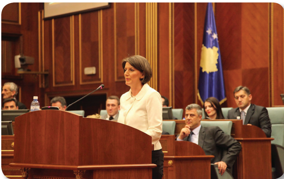
Fjala e Presidentes Jahjaga para deputetëve

Përkrahje për të nominuarën Jahjaga, deklaruan edhe përfaqësuesit e SLS-së dhe ata të grupit Gjashtë Plus.