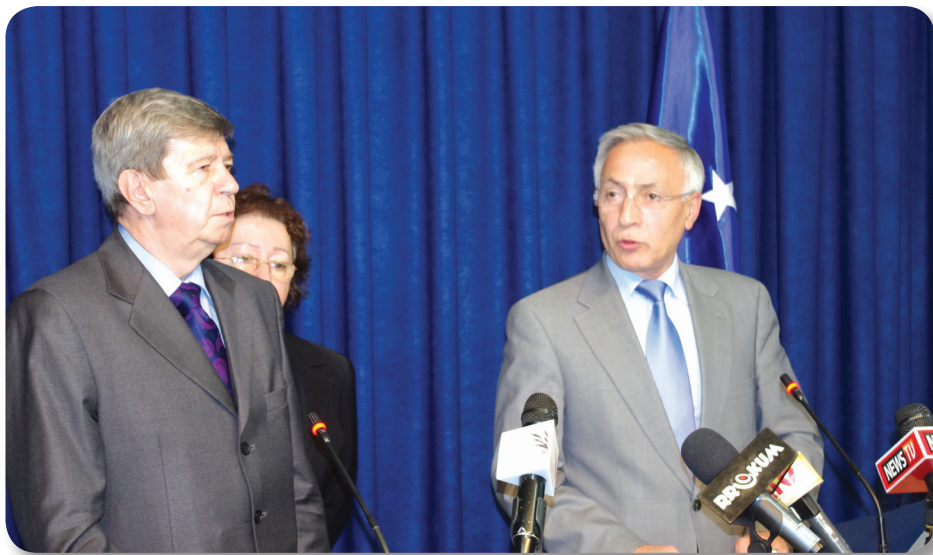
Eduard Kukan - Jakup Krasniqi

Parlamenti Evropian mbështet të ardhmen evropiane të Kosovës. Rikonfirmohen edhe njëherë marrëdhëniet e shkëlqyera me Parlamentin Evropian, qëndrimi i qartë dhe i avancuar që ka ai ndaj shtetit të Kosovës, si dhe mbështetja e pakursyer që Bashkimi Evropian po vazhdon t' i japë Kosovës