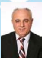
Emrush Xhemajli (PDK) Potpredsednik